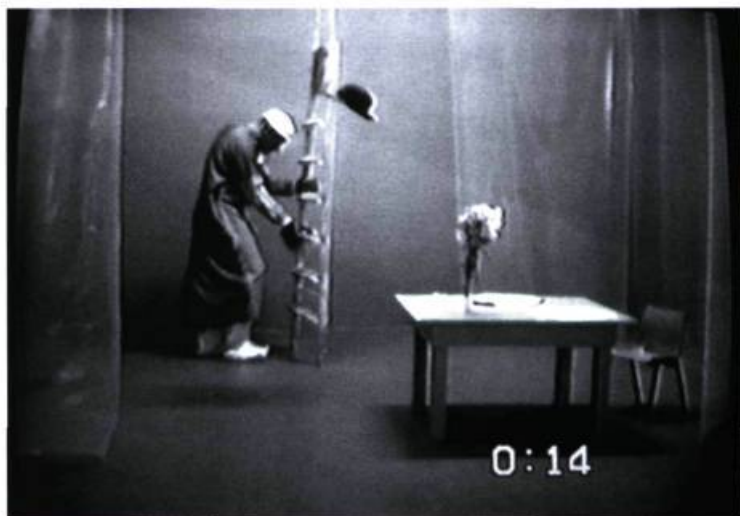
Gilles Barbier, The Doctor's Secret Experiences , 1999. Vidéogramme couleur, son (17 min).

Du 25 mai au 2 septembre 2001 Musée d'art contemporain de Montréal 185, rue Sainte-Catherine Ouest, Montréal (Qc).