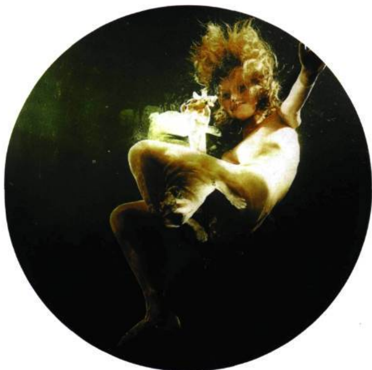
Oleg Kulik, Série Alice Against Lolita , 2000. Duratranse; 100 x 100 cm.

En tant qu'institution indépendante et alternative, nous avons le Centre International d'art contemporain (CIAC), qui est l'ancien Centre Soros. Celui-ci organise des manifestations et des expositions centrées sur les nouvelles technologies artistiques (vidéo, installations, performance, art informatique, multimédia) et sur les productions d'artistes plus ou moins