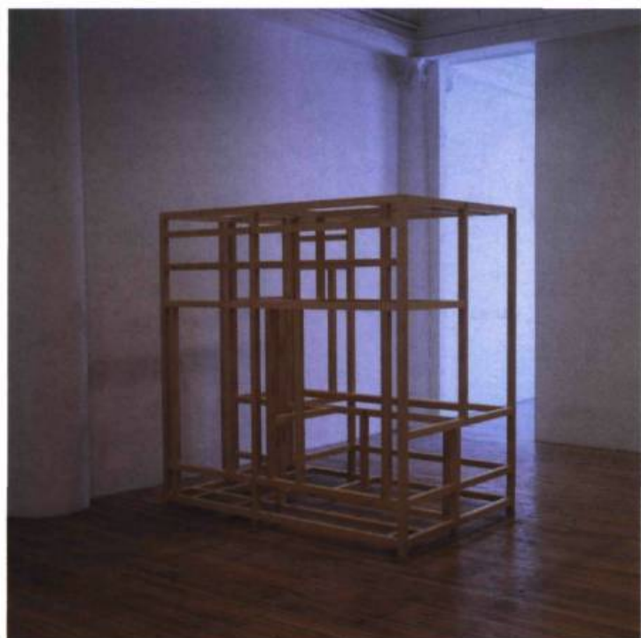
Francine Savard, Casier pour objet du désir (A) , 2000. Bois de tilleul; 213 x 213 x 152 cm.