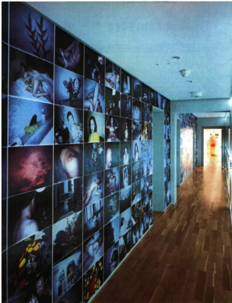
Nobuyoshi Araki, Tokyo Comedy , 1998.

flexion ou à l'expression de pensées et de sensations liées à l'expérience de la prise de vue d'un corps dans l'espace public. Les photos que vous avez dissimulées dans un tel texte non mimétique créent des espèces de trous ou d'abîmes dans votre réflexion, où apparaît ce que l'écriture justement ne peut conter ou raconter et que la photographie seule de la nudité peut exposer dans toute sa nudité. Comment avez-vous pensé le rapport entre le texte et l'image ?