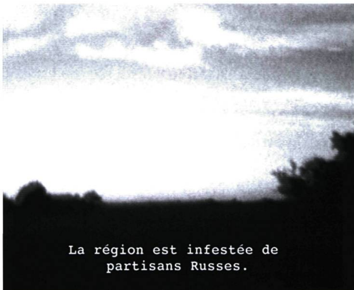
Vidéoconférence du soldat de la Wehrmacht, vers 1942.

nir l'auditeur de la lecture. L'effet captivant de l'installation est toutefois biaisé par la forte interférence que produisent les installations avoisinantes.