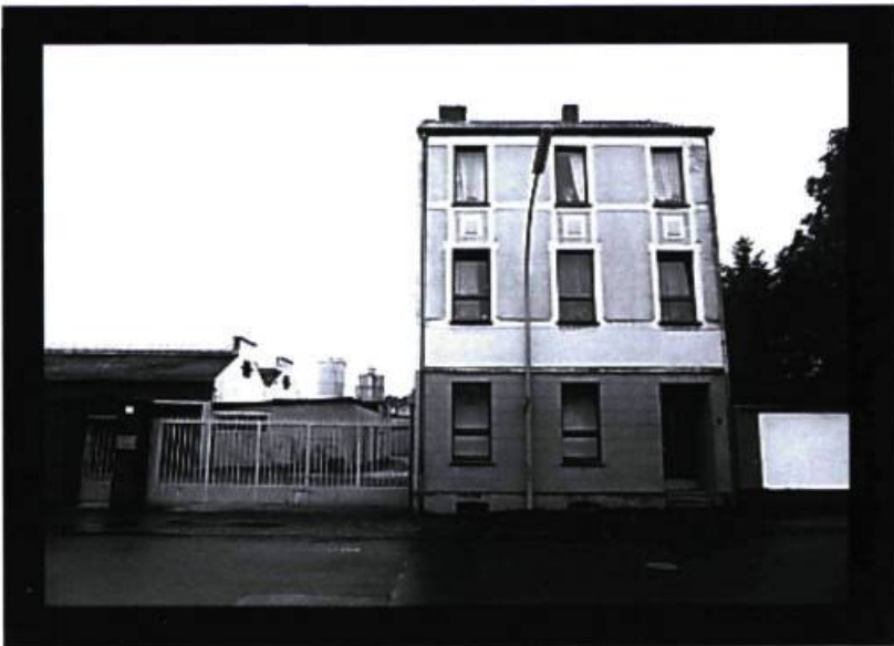
Maison familiale de Gregor Schneider, à Rheydt-Mönchengladbach.