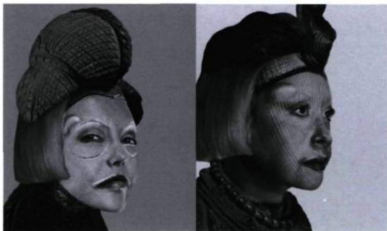
Orlan, African 01 , 2000. Statuaire flé et visage de femme euro-forézienne aux gants avec bossés facio-temporales. Photographie numérique sur papier photographique. * Picto * Lyon. Traitement numérique : Jean-Michel Cambilhou pour * Janvier * de * Janvier *, Paris, 125 x 156 cm.

M. C. : Que ce soit à propos de l'obsolescence du corps ou de la libération des contraintes sociales l'entourant, comme dans le cas de la douleur, ne s'agit-il pas de différentes modalités de cette lutte contre l'idée d'un corps perçu comme destin ?