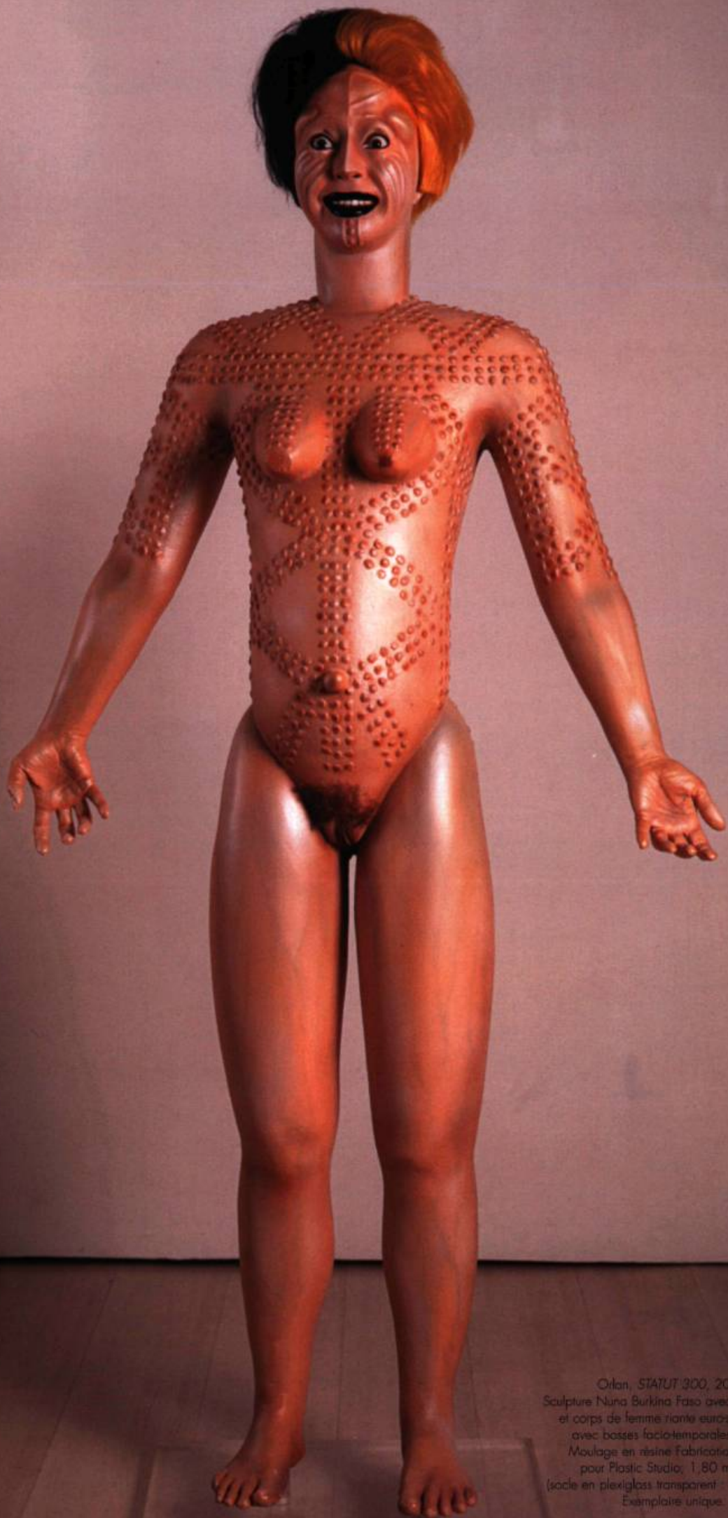
Orlan, STATUT 300 , 2000 Sculpture Nuna Burkina Faso avec scarifications et corps de femme riante eurostéphanoise avec bosses facio-temporales, 2000 Moulage en résine Fabrication Romain pour Plastic Studio; 1,80 m x 1 m (socle en plexiglass transparent : 1,50 m x 3) Exemplaire unique.