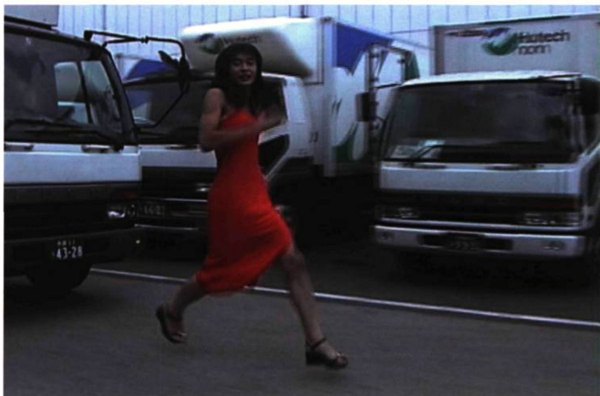
Takehito Kogazenawa, New Men: Consume Yourself .

confectionnés indépendamment les uns des autres par l'artiste et différents musiciens 4 . On the Way to the Peak of Normal n° 2 mixe, par exemple, les vues rapprochées des angles d'une pièce blanche vide avec les sons électroniques distordus de Carsten Nicolai. Selon les fusions opérées, la pièce se remplit d'une infinité de couleurs sonores mouvantes, d'atmosphères pouvant aller de l'absorption douillette au sentiment de désintégration. Paradoxalement, le seul élément stable de l'œuvre est le temps, du fait de sa structure unitaire récurrente. Par conséquent, infiniment renouvelées et délaissées aux caprices du hasard, les histoires contées ici aux spectateurs échappent à leur caractère linéaire légendaire et se donnent comme des structures ouvertes, subjectives et multiples.