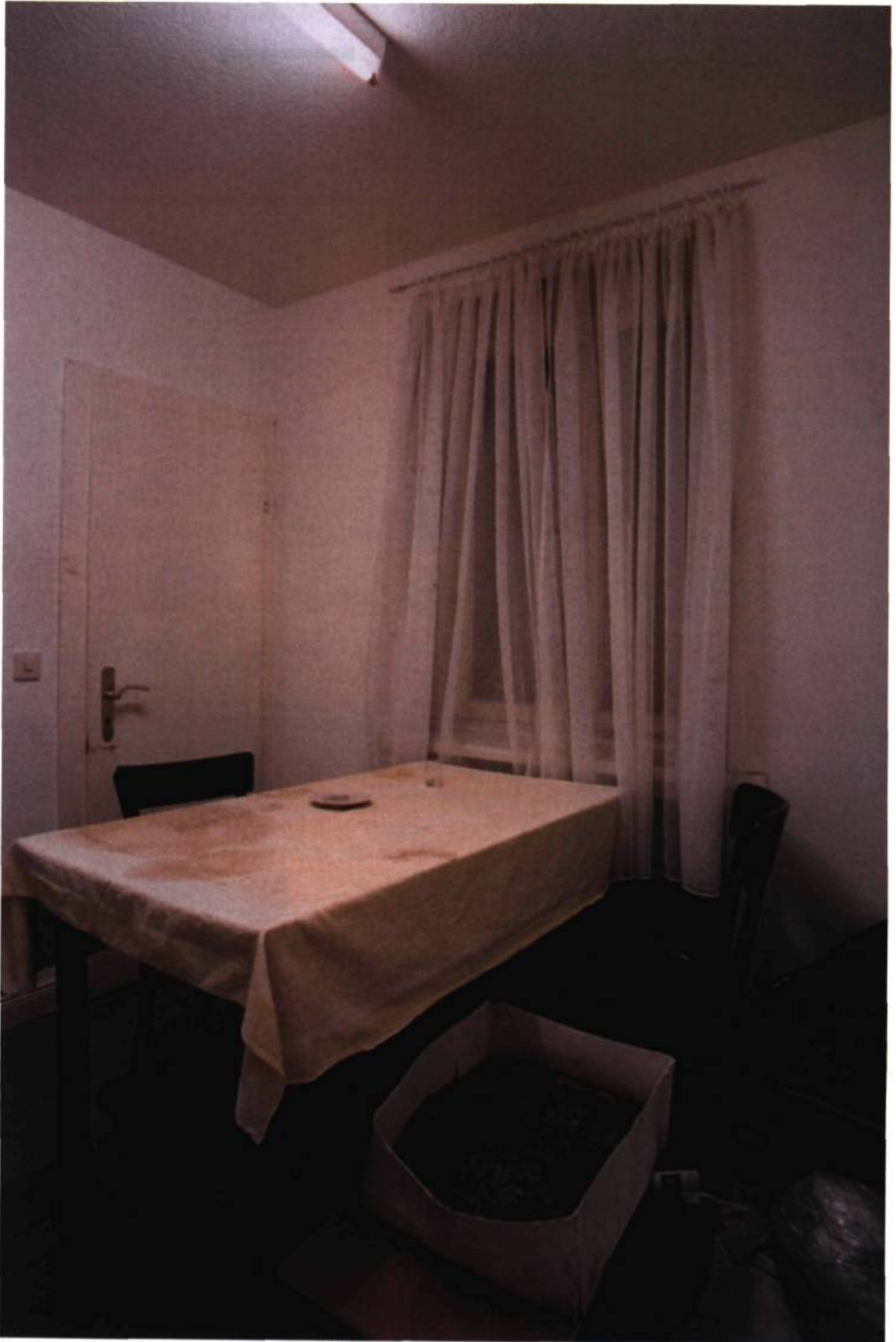
Gregor Schneider, Totes Haus u r , 2001. Venedig.