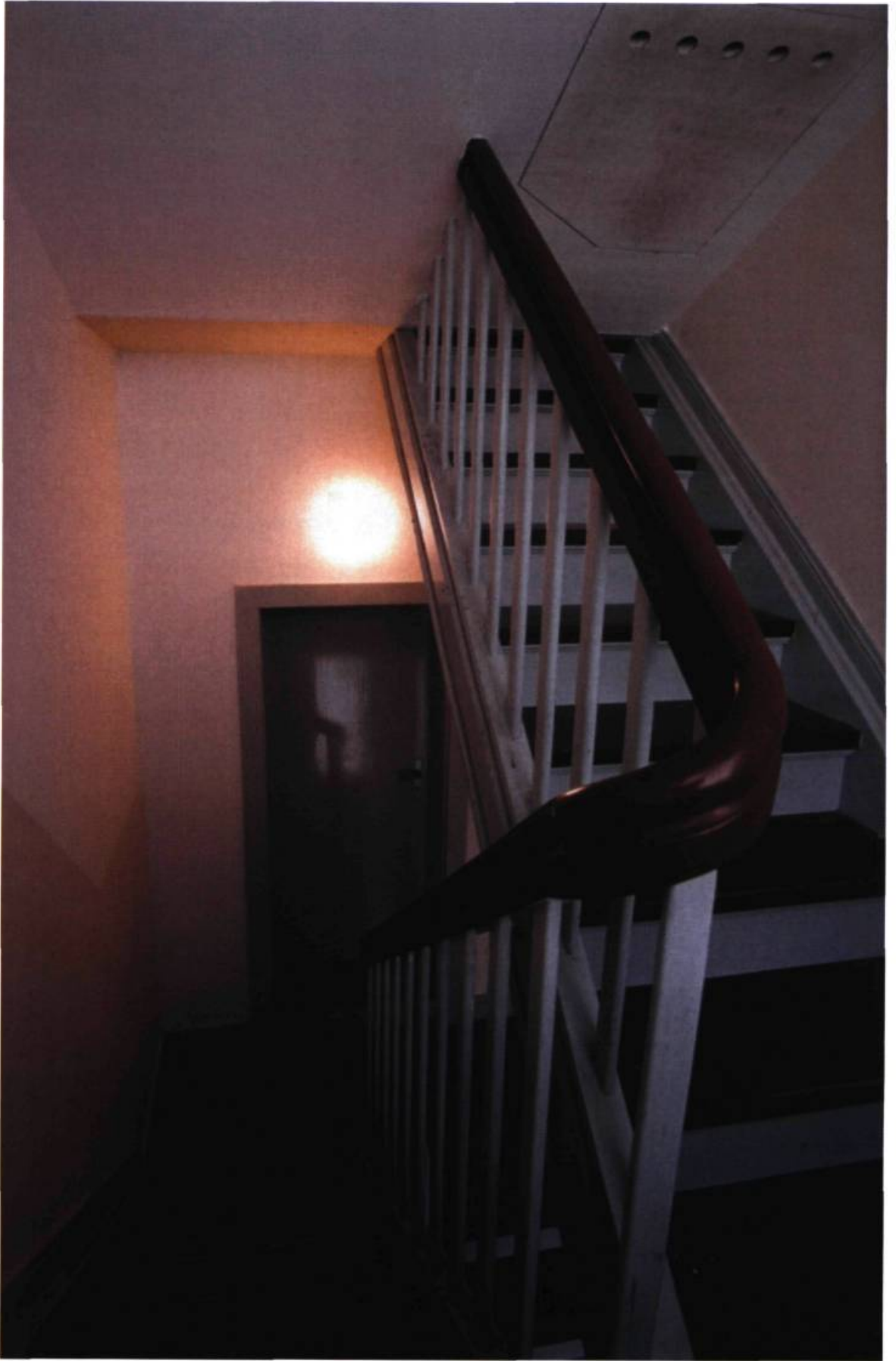
Gregor Schneider, Totes Haus u r , 2001, Venedig.