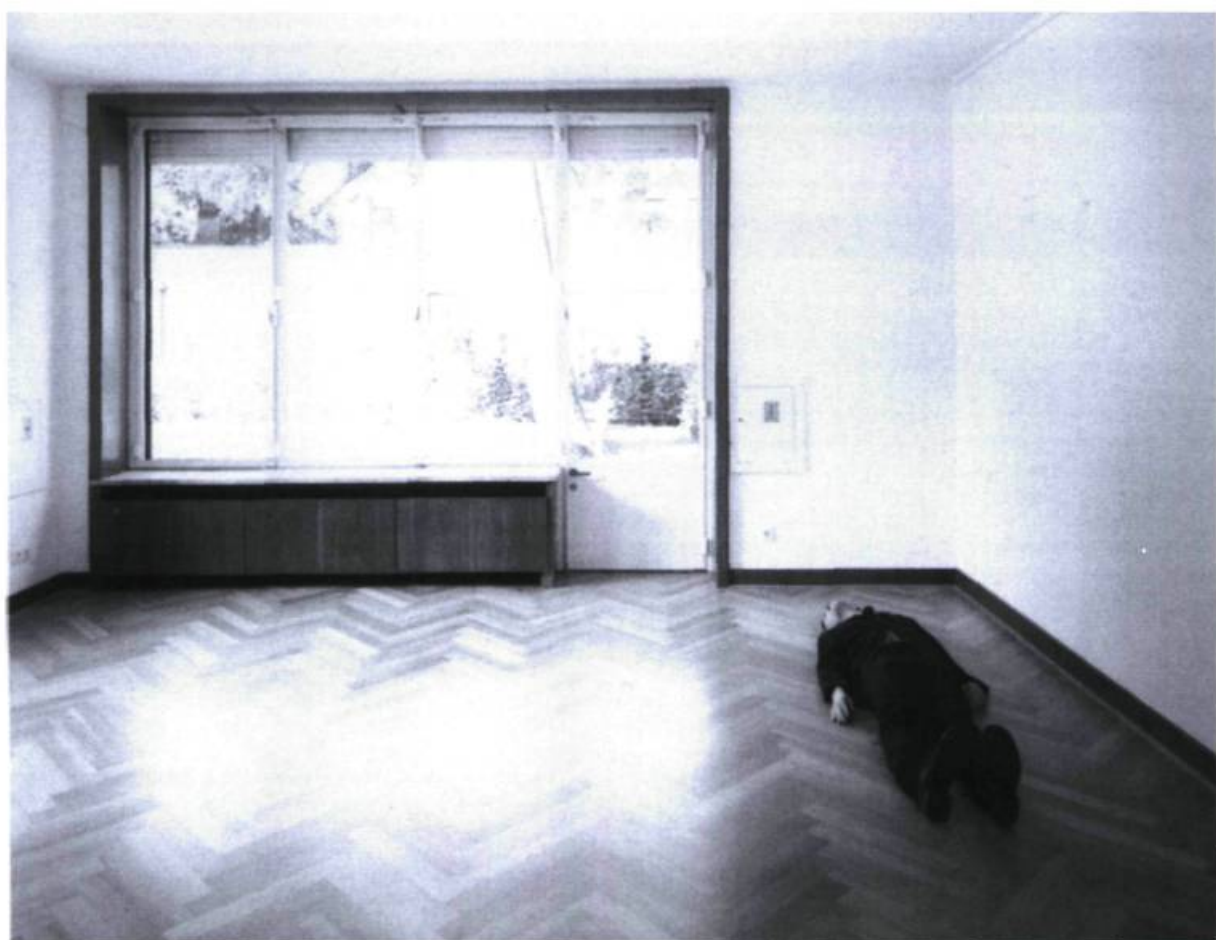
Gregor Schneider, Toter Mann , 2000. Museum Haus Lange, Krefeld © Völker Döhne.

qui sert à la fois de référence principale et de matière première à l'ensemble de son œuvre. Il s'agit d'une modeste maison de trois étages située dans sa petite ville natale de Rheydt, sur laquelle Schneider travaille depuis l'âge de 16 ans, et qu'il partage depuis quelques années avec la mystérieuse Hannelore Reuen. Les installations à caractère architectural de l'artiste – salles, chambres ou enchaînements spatiaux – proviennent toutes plus ou moins directement de cette maison privée. 2 Les pièces sont parfois découpées et extraites de la structure même de Haus u r pour être ensuite reconstruites ou reproduites suivant un processus de duplication lent et précis. Une fois l'exposition terminée, l'artiste les démonte et, éventuellement, les réintègre à la structure de la maison, recomposant ainsi cette dernière. Cet habile manège de l'espace dans le temps conduit toutefois à un paradoxe : en détruisant perpétuellement les pièces qu'il recrée, Schneider arrive à produire des lieux à la fois très éphémères et possédant une étrange pérennité. Ses installations – copies instables d'un original inexistant – pointent toujours vers la même maison, le même espace ou l'idée même de la spatialité. La notion d'œuvre, de même que ses rapports au monde, se trouvent ainsi remis en question et, simultanément, stabilisés.