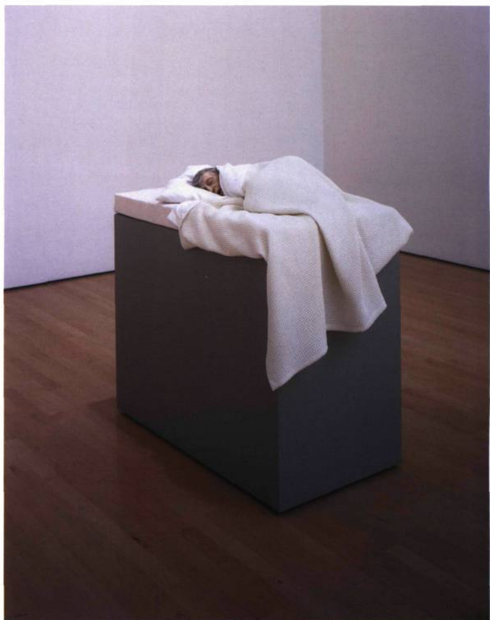
Ron Mueck, Sans titre (Vieille femme au lit) , 2000. Caoutchouc de silicone, résine de polyester, coton, mousse polyuréthane, polyester, peinture à l'huile; 24 x 94, 5 x 56 cm, socle : 100, 3 x 94, 5 x 56 cm; Musée des beaux-arts du Canada, Ottawa/acheté en 2001. © Ron Mueck, gracieuseté d'Anthony Offay.