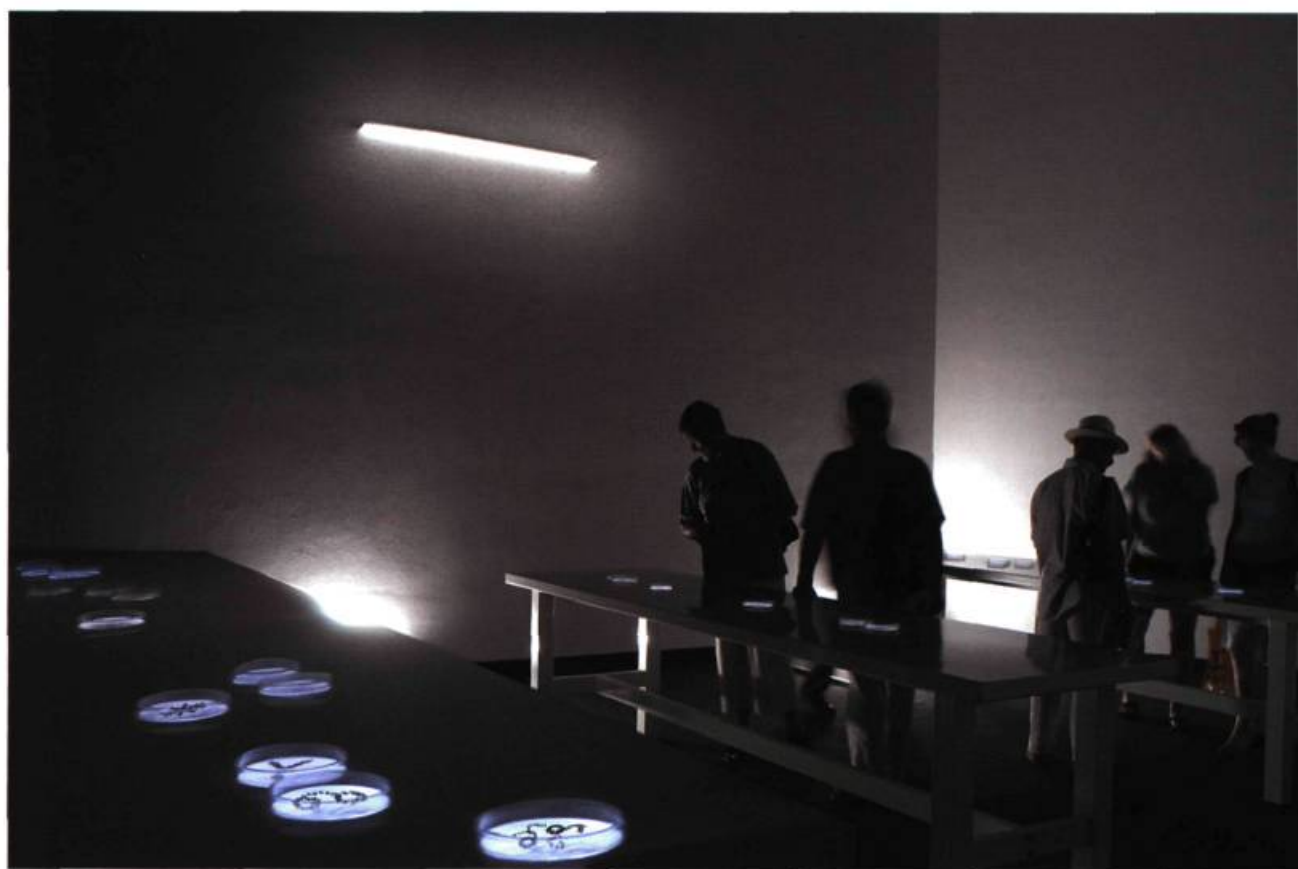
Michal Rovner, Data Zone , 2003. Installation (détail).