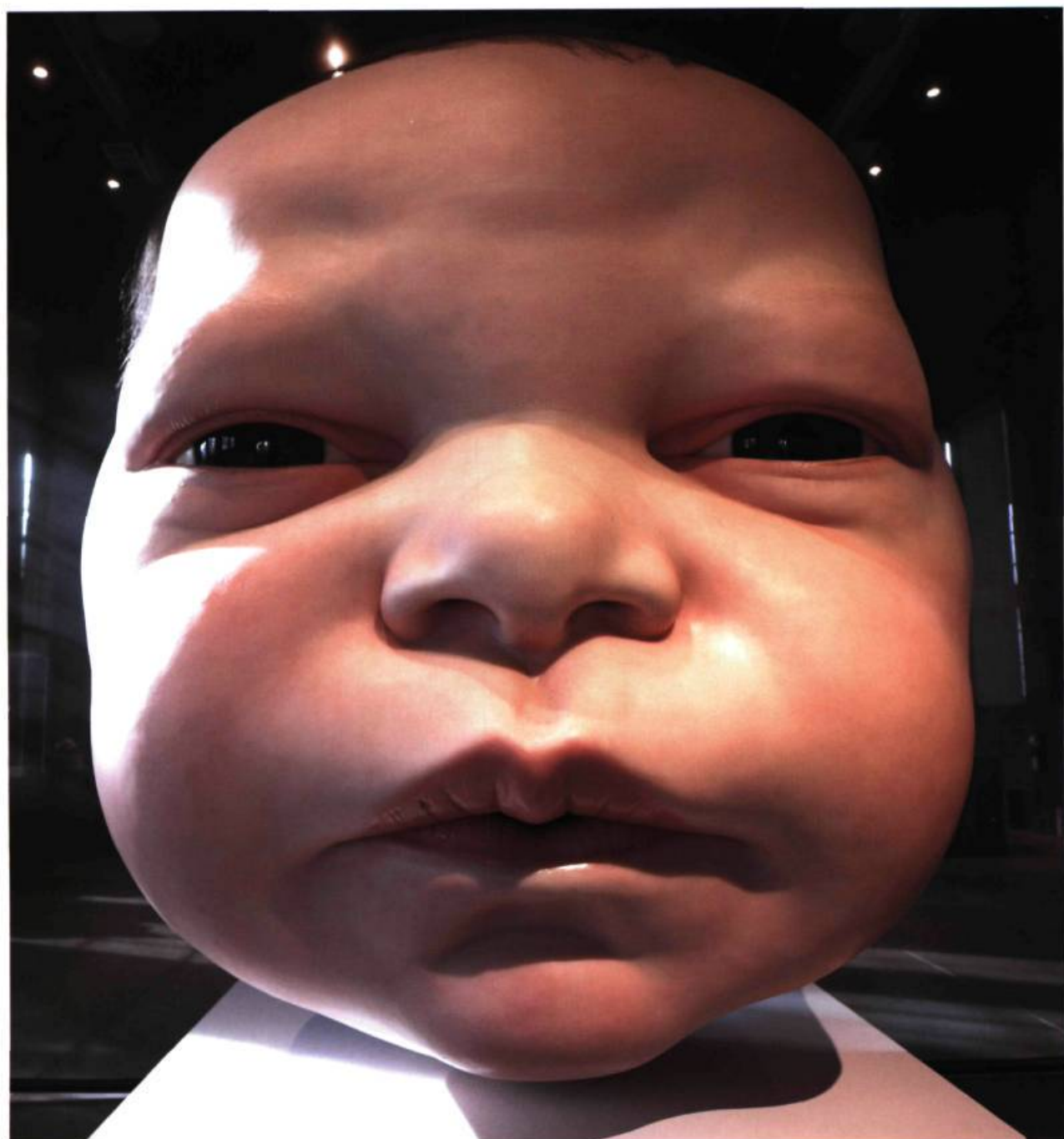
Ron Mueck, Sans titre (Tête d'un bébé) , 2003. Silicone, résine de fibre de verre et techniques mixtes. Musée des beaux-arts du Canada, Ottawa/achetée en 2003. © Ron Mueck, gracieuseté d'Anthony Offay, Photo © Musée des beaux-arts du Canada.