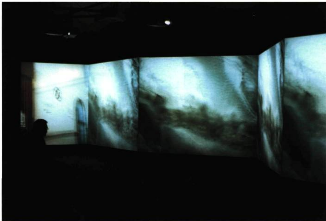
Jana Sterbak, From Here to There (détail intérieur). Pavillon canadien.

terdam. À proximité mais à l'écart du pavillon, l'installation du même nom offre une image forte des problèmes de l'immigration et des mouvements de populations étrangères reléguées à la marge des villes, et par extension de la société. De plus, repositionnée dans le contexte de la Biennale, Respect suggère l'étroitesse de l'idée de nation et la nécessité d'en faire exploser le carcan. Leçon d'ouverture dynamique, l'exposition We are the World discute ainsi beaucoup mieux que la tentaculaire multiexposition : Rêves et conflits , de Bonami, les conditions et les règles de la globalisation dans le monde actuel.