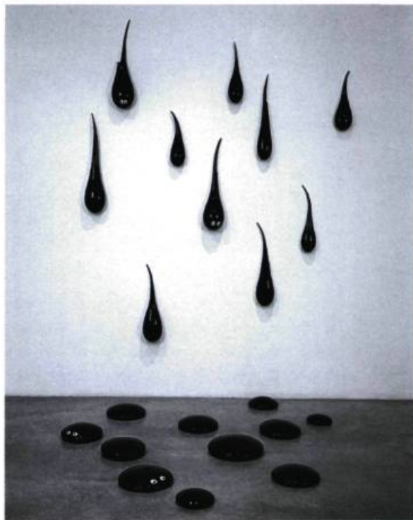
Fred Willson, Drip Drop Plop , 2001. Verre. Cointoise de l'artiste et Metro Picture.

Bonami a donc réalisé une Biennale par excès, qui a perdu le sens de sa raison d'être en voulant trop ressembler à ses pairs. Entouré d'une dizaine de commissaires – tous éminents spécialistes de la scène artistique d'une partie du monde, à l'instar de Catherine David pour le Moyen-Orient –, il a ainsi cru bon de singer la structure traditionnelle de la Biennale en octroyant à chaque commissaire un espace et carte blanche pour réaliser une exposition dans l'exposition 7 : un pavillon thématique au lieu d'un pavillon national. Il en est résulté une enfilade de neuf expositions sans fil conducteur, si ce n'est à travers les intitulés affublés à chaque section par chaque commissaire et l'architecture de l'ensemble : une sorte de grand portail arborant fièrement, en grand, titre et auteur annonce chaque