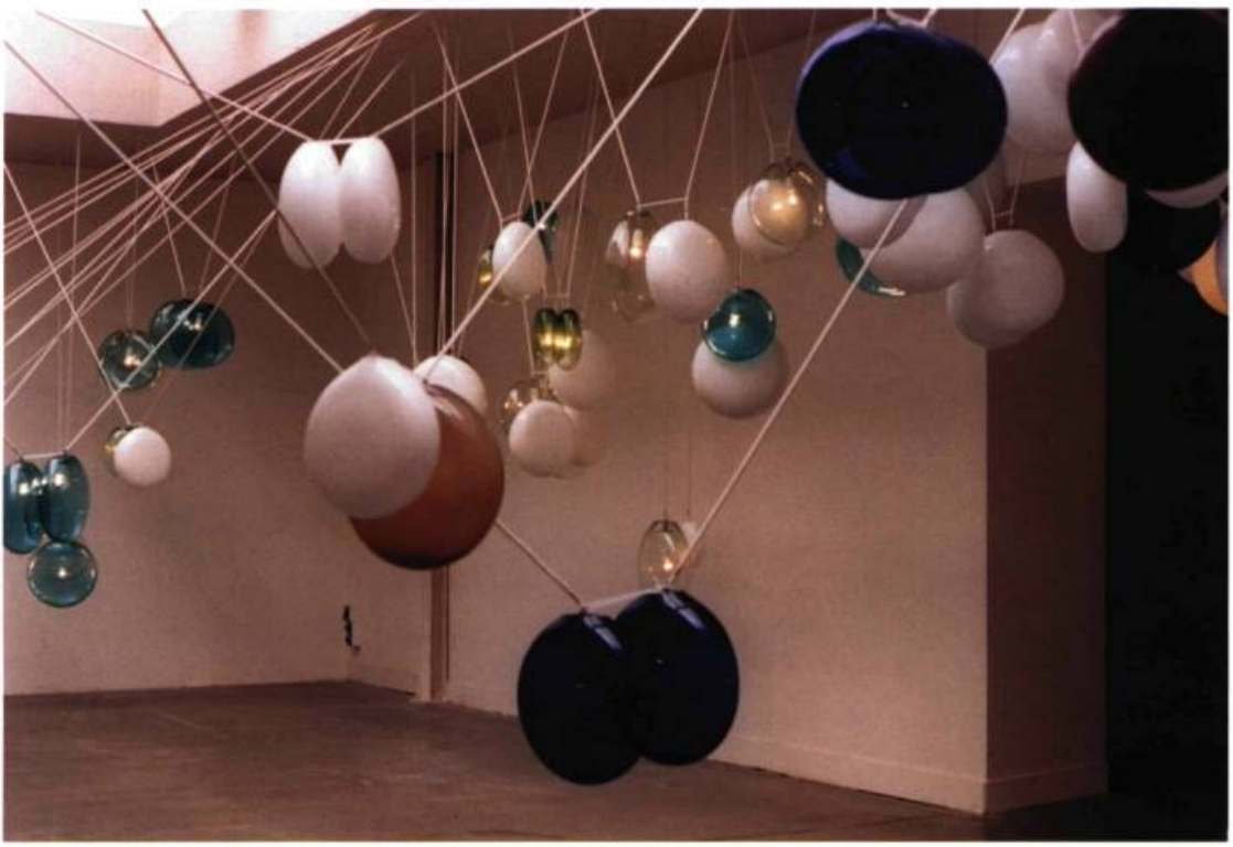
Topios Rehberger, Exposition Delays and Revolutions , Giardini, Pavillon italien.

graphie du paysage et à l'amour du Canada pour la nature.