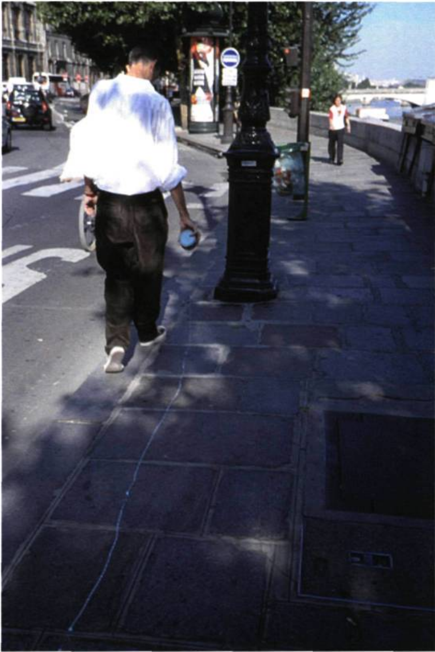
Francis Alys, The Leak, Paris, octobre 2003.

et autres témoins réunionnais sur l'histoire de ce lieu façonné par les notions de passage, d'hybridation et de pluralisme. Contrastes marqués. Centre et périphérie. Occident et tiers-monde. Origine et parcours. Métissage et partage de la spécificité. France d'outre-mer ou colonie. À l'heure du débat alter mondialiste, l'installation nous fait voguer entre ces polarités. Entre la revendication identitaire pure et dure de la créolisation ou le déni radical des origines réunionnaises, une vérité complexe apparaît.