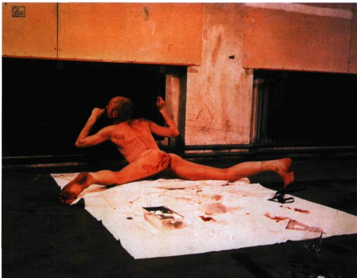
Günter Brus, Zerreisprobe , 1971.

« périphériques », en fonction du centralisme jusqu'à présent plutôt égocentrique du marché de l'art, ont un caractère frontal, agressif, provoquant et pulsionnel qui ne s'embarrasse guère d'esthétismes ou de détours.