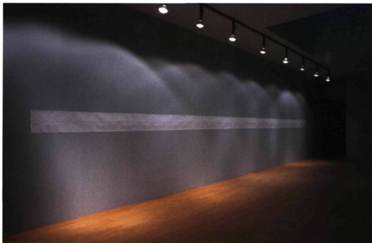
Martin Boisseau, Dixième temps : regarder debout, dormir dessous , 2004. Dessin à l'encre noire sur papier arche. Graff, Montréal.

Nous accueillons à l'entrée de la galerie, dans la première salle, la plus grande, un long ruban de papier sur lequel n'est dessinée qu'une longue ligne, tirée d'un bout à l'autre. Cette œuvre est-elle le résultat d'un simple mouvement de trait à main levée ? Proviendrait-elle d'une des machines antérieures de l'artiste dont une exposition antérieure nous avait révélé le potentiel créatif ? Elle représente certes le mouvement minimal de la création artistique, un faire essentiel. Cette ligne est en effet si longue qu'elle ne peut