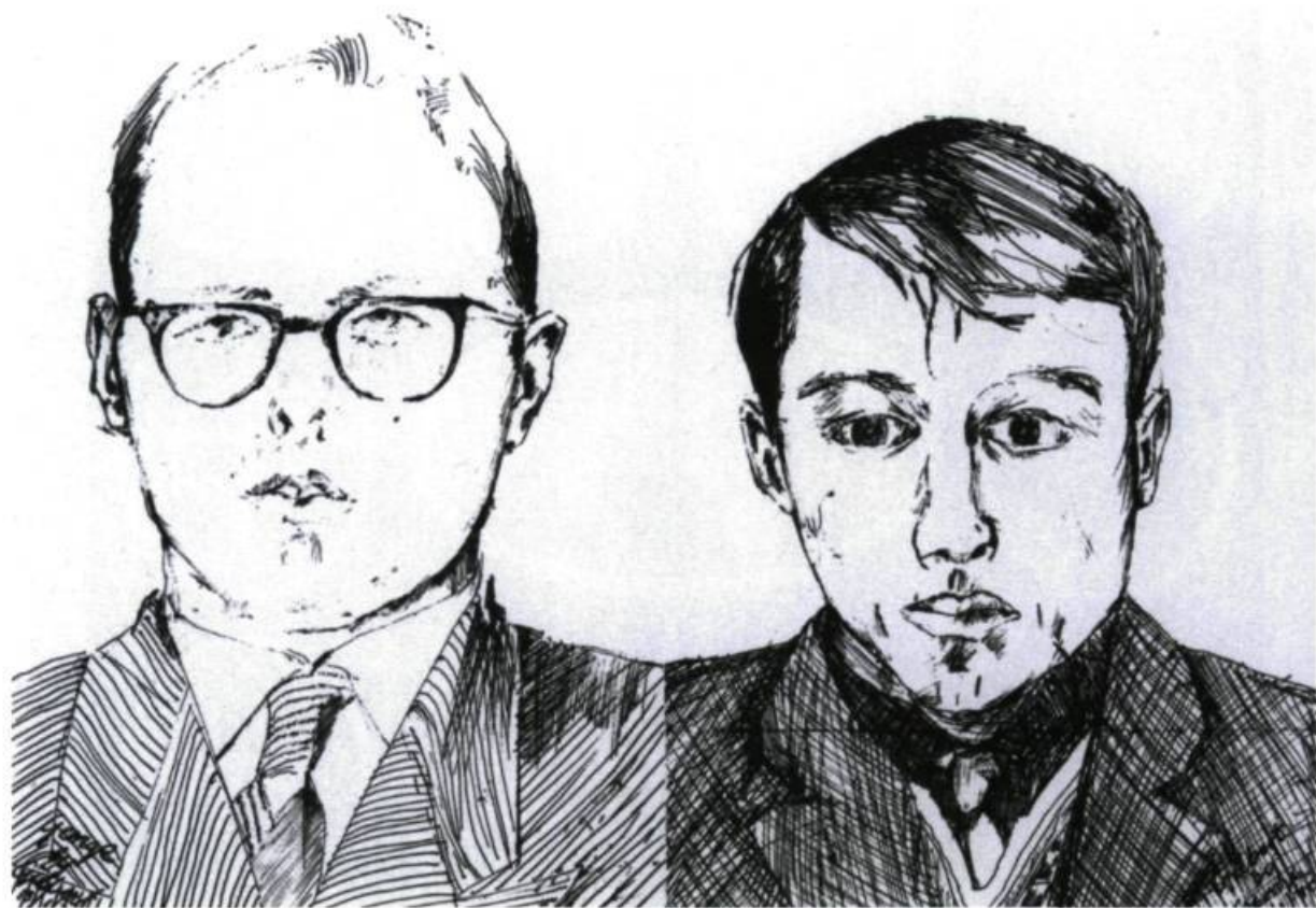
Gilbert & George, George by Gilbert and Gilbert by George , 1970. 30 x 42 cm. Art & Project, Bulletin n° 20.

fonction critique qu'elles exercent au sein d'un champ d'intervention dans lequel la figure de l'artiste fait encore office d'unité monolithique. À coup sûr, notre doxa tient toujours à la monographie en laquelle se révèle la vérité d'un sujet-artiste. De là surgit l'intérêt de se pencher sur quelques démarches identitaires confrontant le moi à autrui (qui est parfois joué par le moi lui-même). Or, il me paraît que de tels mariages produisent du sens en dévoilant de façon ludique les conditions de possibilité de la fonction d'artiste telles qu'elles sont incessamment à l'œuvre dans le monde de l'art qui est le nôtre.