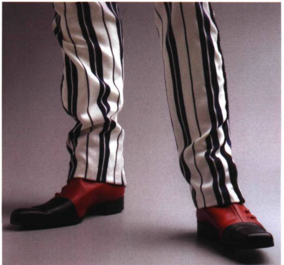
Rodney Graham, Detail of costume from City Self/County Self , 2000.