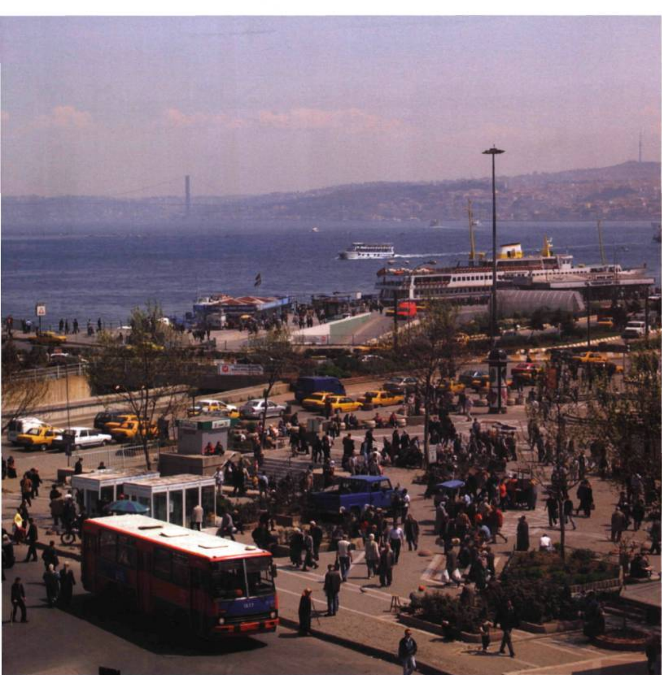
Claire Chevrier, Croisementville 04 (Istanbul 12, 2003) , 2003. Photographie; 40 x 50 cm.

treilles rectilignes, L. A. Chinatown (2003) nous fait découvrir ce que nous pourrions tout aussi bien situer à la limite fantomatique de Paris intra/extramuros, de même qu'au détour du réseau de freeways enserrant Pékin. Ici ou là-bas, le monde se présente dans l'indifférence du monde, édifiant comme un seul monument à la périphérie des grandes villes ses « exo town » ou « exo land », dont le Chinatown de Los Angeles vient offrir l'emblème.