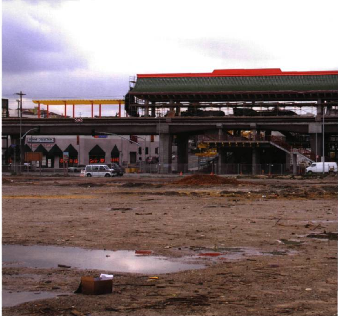
Claire Chevrier, Espace + construction 03, L. A. Chinatown , 2003. Photographie; 60 x 80 cm.

d'un « temps de détresse » où se reconnaît la vision d'un temps inaccompli.