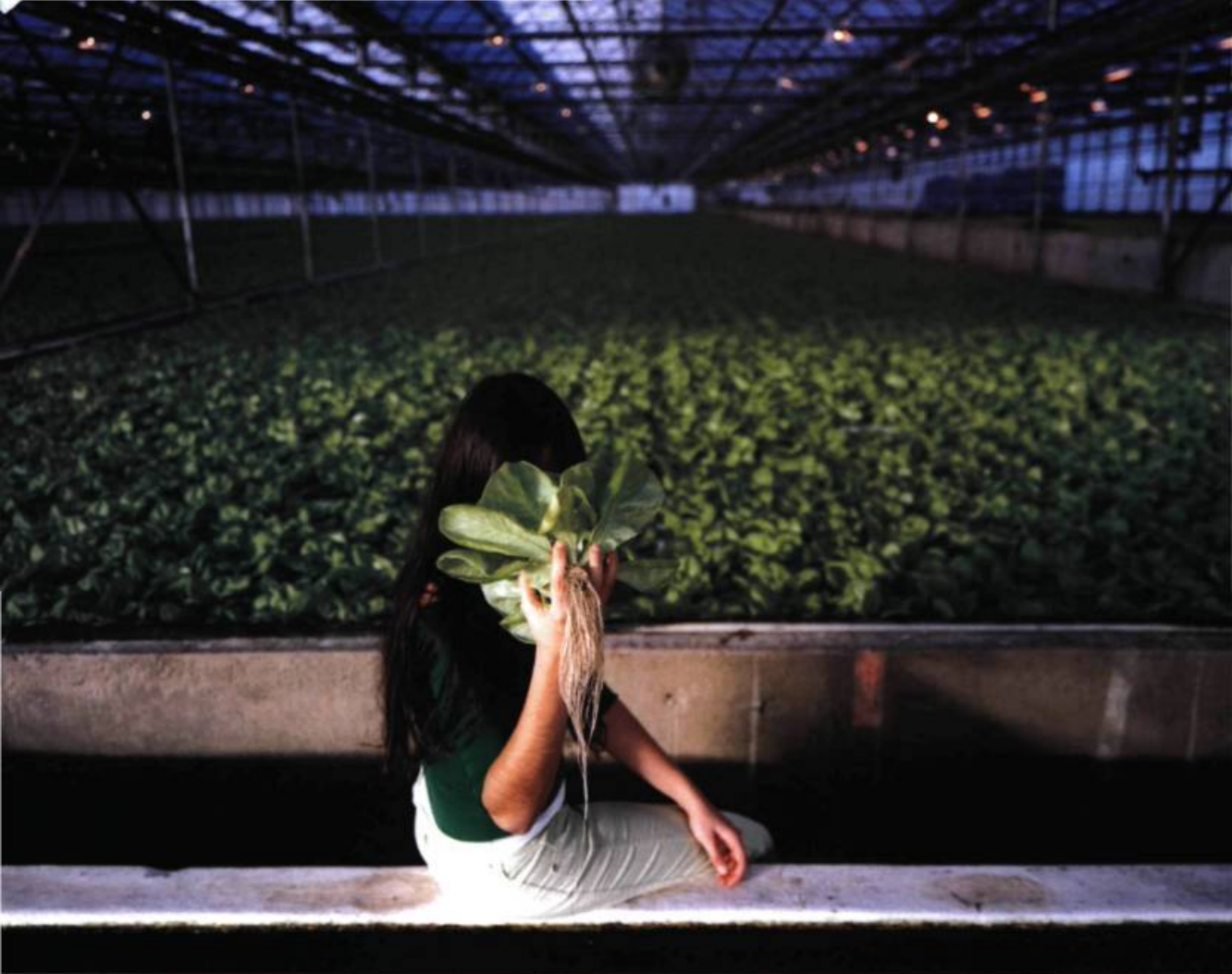
Ève K. Tremblay, Mémoire anticipée d'une jeune fille dérangée , 2004. Épreuve chromogène; 102 x 125 cm. © Ève K. Tremblay.