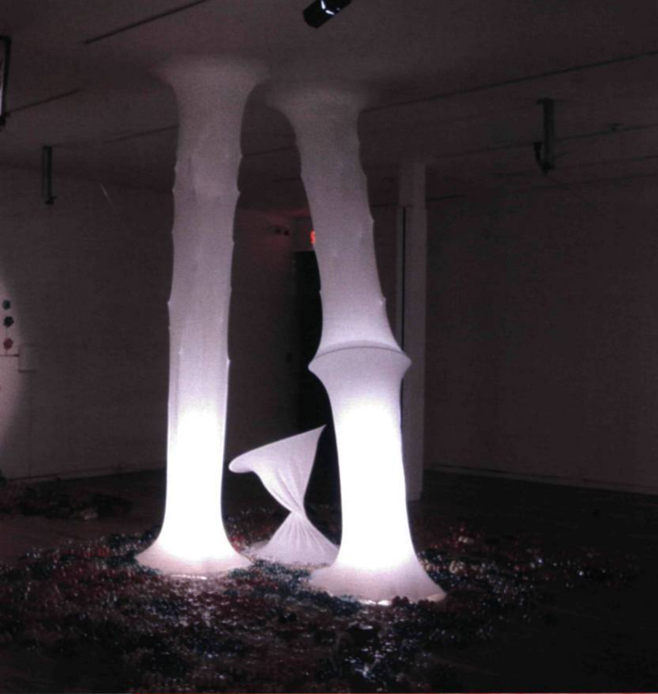
Aude Moreau, Sugar Carpet , 2002. Installation in situ; 3.50 x 600 cm.