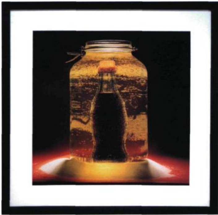
Thomas Blanchard, Aspartham. Série Fabricated Food , 2003. Épreuve chromogène ; 40,6 x 40,6 cm.

L'installation de Karen Tam induit également une dynamique de rencontre avec l'autre, mais cette fois dans une confrontation des cultures. Née à Montréal de parents chinois, l'artiste interroge la perception du monde chinois en Occident. Dans la lignée de sa précédente installation au M.A.I en 2004, Jardin Chow Chow Garden est un restaurant recréé en résidence. Le regard occidental est leurré par ce qu'il croit être un authentique restaurant chinois, mais relève en fait de ce que Karen Tam nomme des « restaurants chinois américanisés », destinés à un public friand d'exotisme paradoxalement adapté à ses goûts.