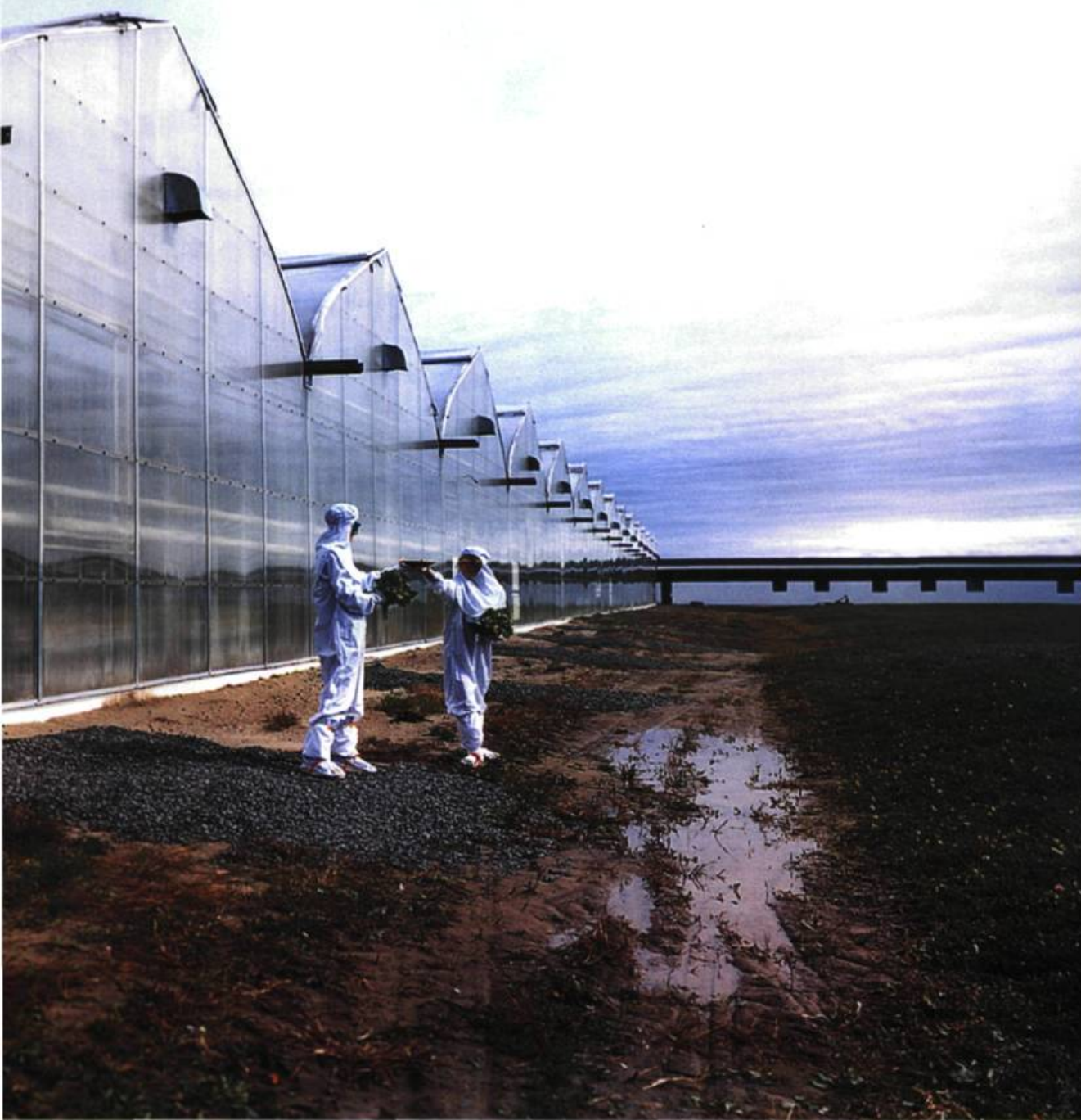
Ève K. Tremblay, Hors serres . Photographie.

laser , deux personnages, toujours de blanc vêtus, la tête recouverte d'un couvre-chef de même couleur, semblent mesurer le degré d'humidité de la terre où s'enracine une salade. Nous sommes là bien loin de la référence futurologique que nous laissait espérer pareille formulation. De même, Les pleureuses montrent deux silhouettes lointaines, toujours blanchâtres, penchées sur les tâches à accomplir dans une serre au sol piqueté des feuilles vertes d'un légume encore immature. Bref, il y a de l'effet dramatique dans ces titres, un effet qui vient forcer un sens et conditionner notre lecture de ce qui est montré. Ces réminiscences, aux