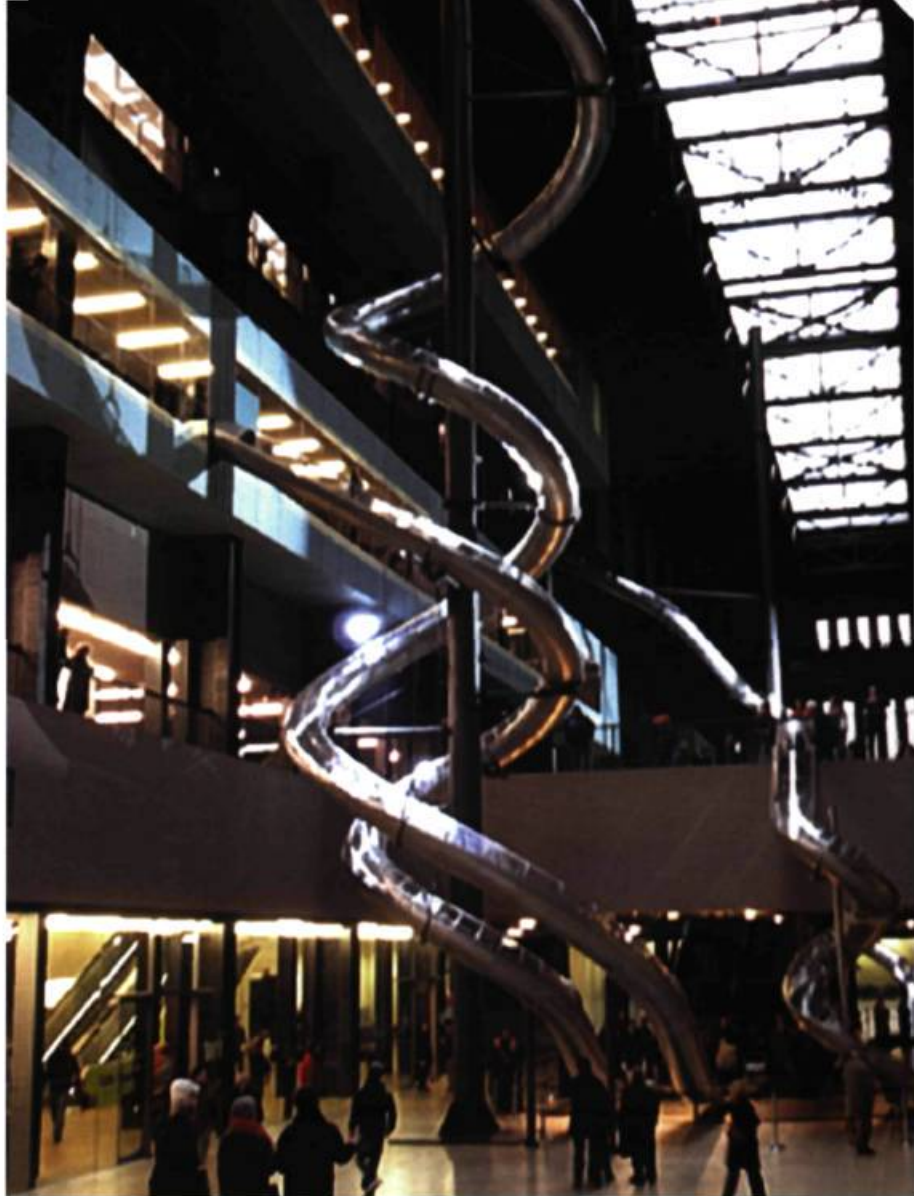
Carsten Höller, toboggans, hall des turbines de la Tate Modern, Londres. [Site test, 2006].

donnée lors d'un séminaire à l'Université de la Sapienza à Rome en mai 2006, citée par B. Stiegler et ars industrialis, Réenchâter le monde , Paris, 2006, p. 46.