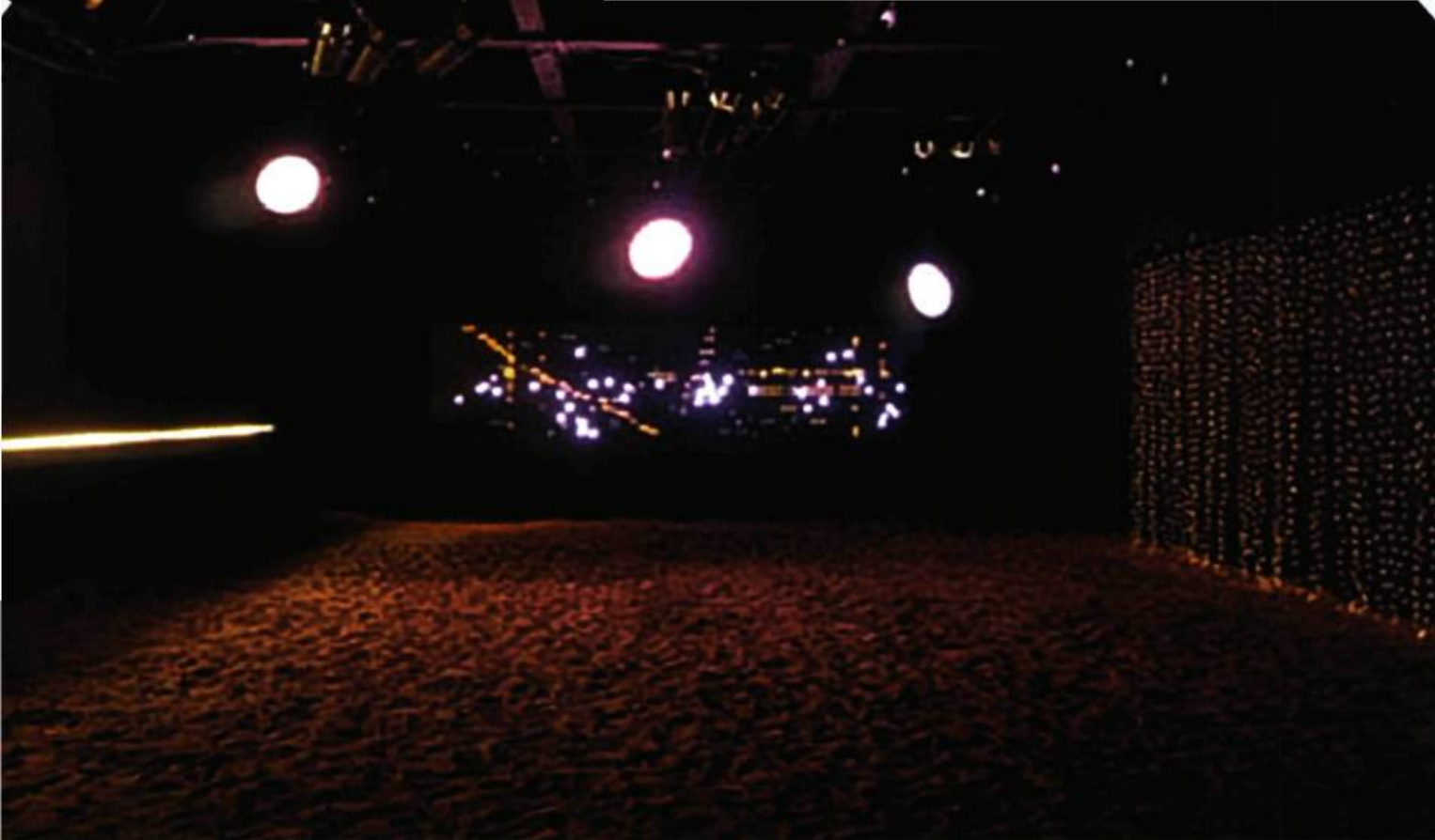
Dominique Gonzalez-Foerster, Cosmodrome , Biennale de Lyon 2003.