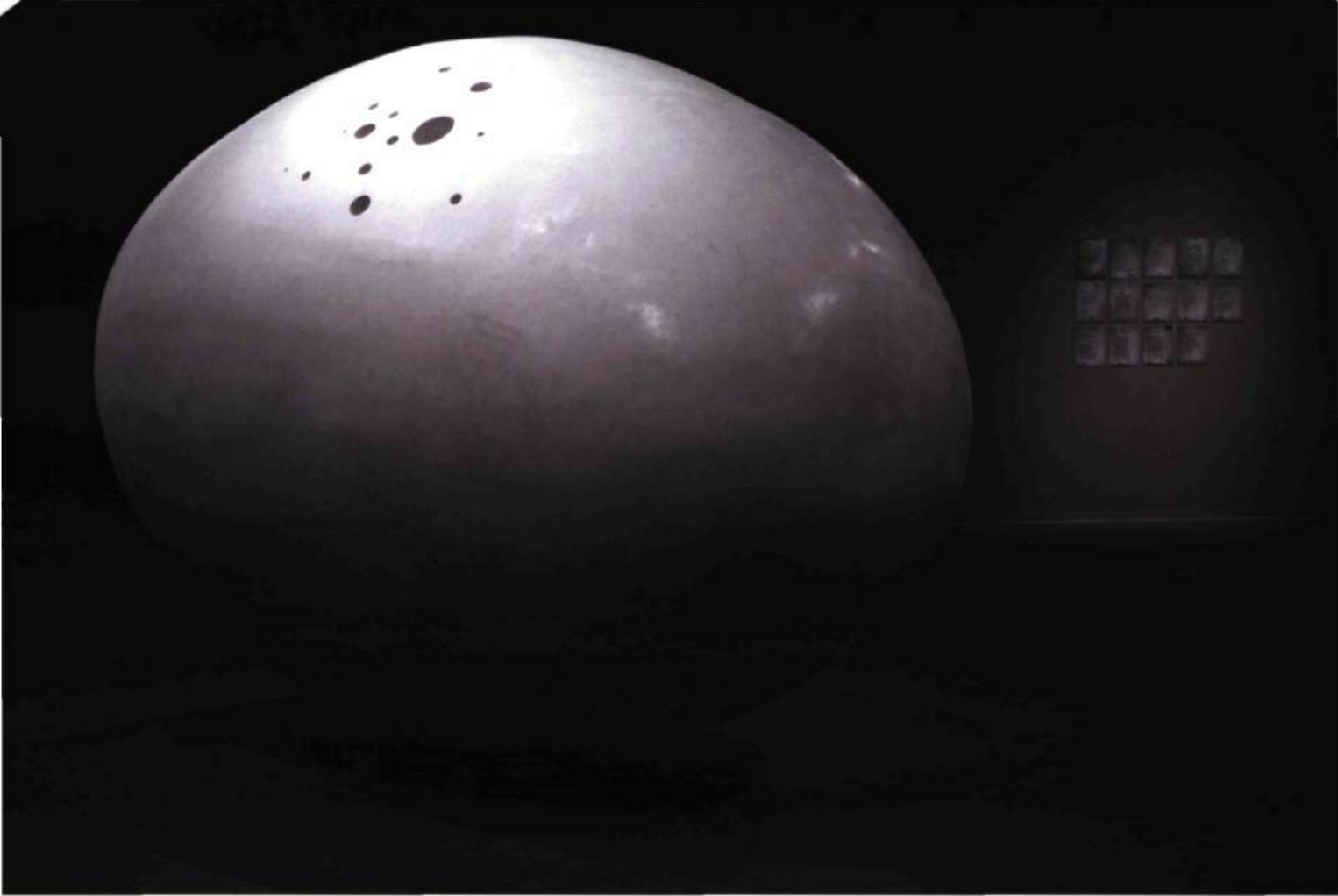
Michel de Broin, L'engin , 2006. Bois, fibre de verre, ciment modifié au polymère. Collection de l'artiste.

de Broin nous propose d'exhiber comme œuvre d'art la pièce à conviction manquante, soit quelque chose qui ressemble à un missile, à une fusée ou un réacteur d'avion. Bel objet exposé, qui peut fonctionner aussi comme un habitacle capable d'accueillir les spectateurs, et qui vient accompagné de sa propre légende, selon laquelle son entrée dans le musée aurait exigé de démolir une partie du mur du bâtiment. Michel de Broin réinscrit ainsi dans le récit de l'exposition de l'objet d'art des éléments du récit théorique qui encadre les versions alternatives du 11 septembre. Pour compléter l'exposition et expliciter son questionnement, il nous propose une pièce « parlante », Silent Screaming , où une machine efficace et très low tech s'active à faire le vide dans une cloche de verre sous laquelle une impressionnante sirène sonne sans réussir à produire le moindre son. Bref, il a fabriqué une machine produisant un non-effet, un non-être dans le réel.