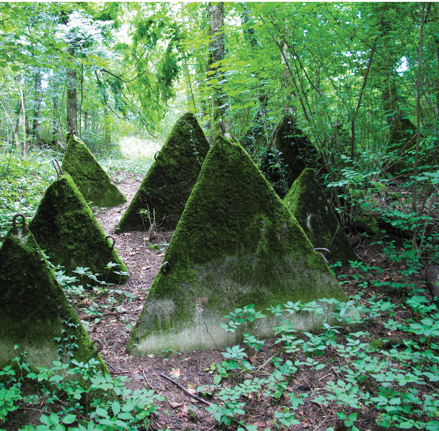
Virginie Laganière, série Tablerones , 2015. Photographie numérique ; exposition collective à Art Souterrain 2015 : Sécurité : que reste-t-il de nos espaces de liberté ? , Palais des congrès, Montréal.