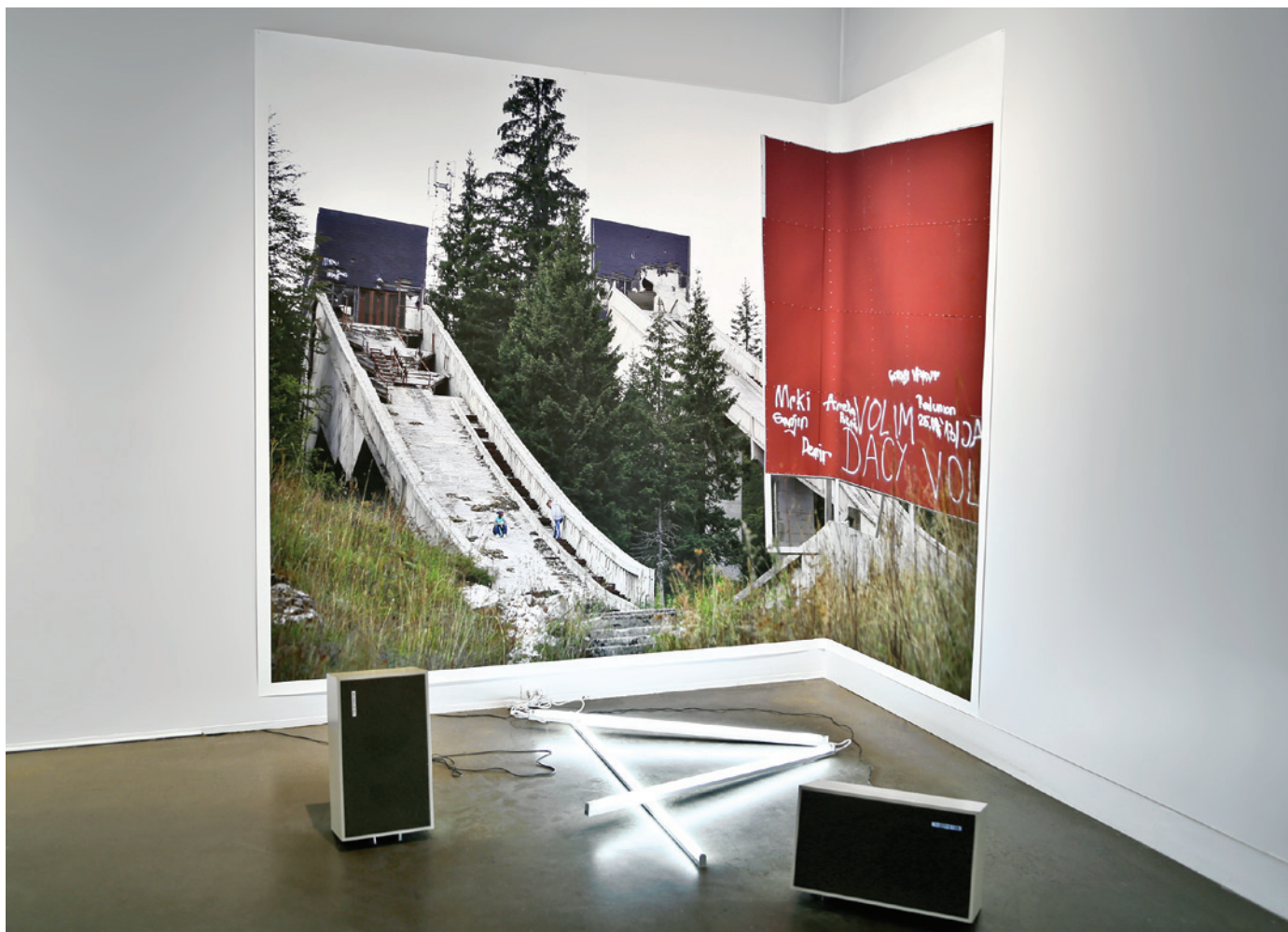
Virginie Laganière, Post Olympiques , installation photographique, 2014. Projet en cours de 2012 à 2015. En collaboration avec Jean-Maxime Dufresne, VU, Québec.