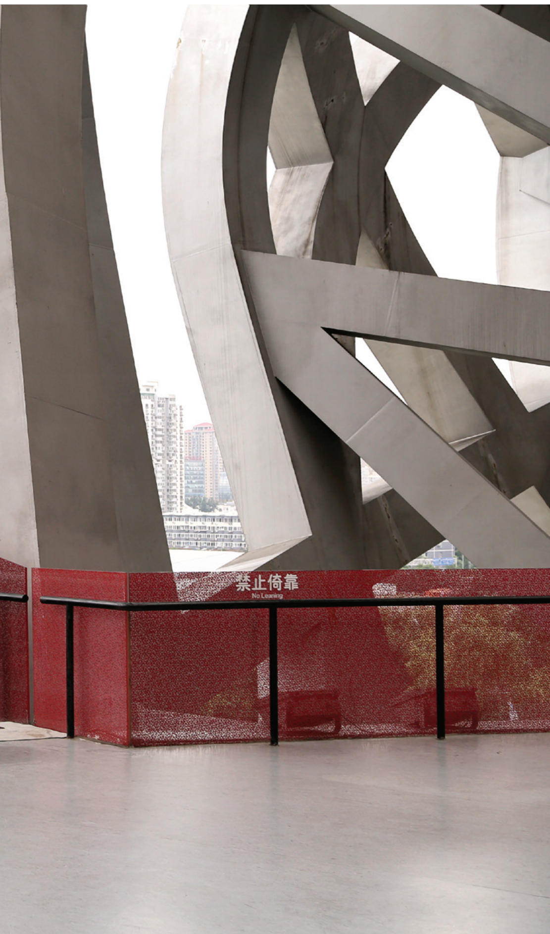
Virginie Laganière, Post Olympiques , installation photographique, 2014. Projet en cours de 2012 à 2015. En collaboration avec Jean-Maxime Dufresne, VU, Québec.