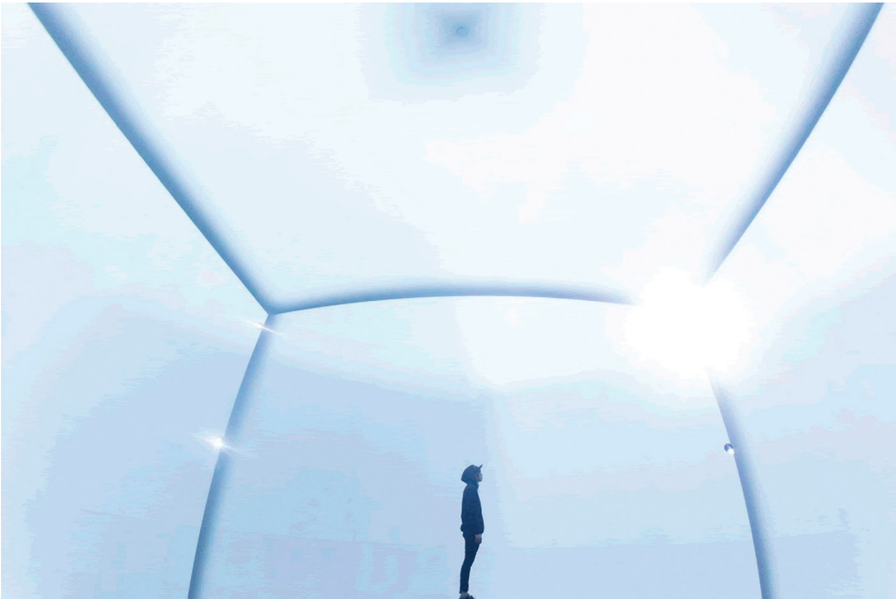
Nonotak, VERSUS, 2015-2016. Satosphère, SAT – Société des arts technologiques, Montréal.

abstraite et électronique martèle le rythme régulier et incessant de ce mouvement. Elle garde le spectateur en alerte tout en lui donnant une étrange sensation de réconfort.