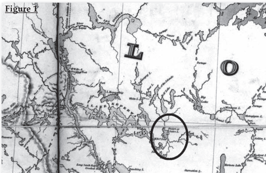
Détail de la carte de Bouchette, montrant l'emplacement du Desert's Post. Nous avons encerclé l'endroit en question

Les années présentées ici sont les seules conservées dans les archives. Les décisions prises lors de ces conseils étaient sensées s'appliquer pour la saison à venir. Par exemple, l'information donnée pour 1839 s'appliquait (normalement) pour la saison de traite de 1839-40. Étant donné que le poste portait déjà le nom à Desert à l'été 1839, on peut supposer qu'il fut établi un peu avant la tenue de ce conseil, probablement en 1838. Nous savons qu'il fut fermé en 1847, lors de l'ouverture d'un nouveau poste, Hunter's Lodge, qui venait remplacer le poste à Desert ainsi que celui d'Opemica 11 . Fait significatif : Louis Desert quitte son emploi au même moment 12 .