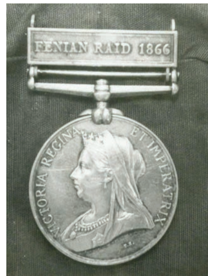
Médaille de commémoration à l'effigie de la reine Victoria remise aux miliciens ayant combattu les Fenians.

Cette reconnaissance tardive n'est pas innocente. En effet, le Dominion britannique joue la carte patriotique dans une tentative pour faire accepter une guerre coloniale impopulaire en cours en Afrique du Sud, contre les fermiers afrikaners d'origine hollandaise et allemande, les Boers. La guerre des Boers implique plusieurs contingents canadiens et divise politiquement francophones et anglophones. Ironie de l'histoire, des unités de guérilla irlandaise de l'IRA (Irish Republican Army) sont présentes en Afrique du Sud pour lutter contre l'Angleterre.