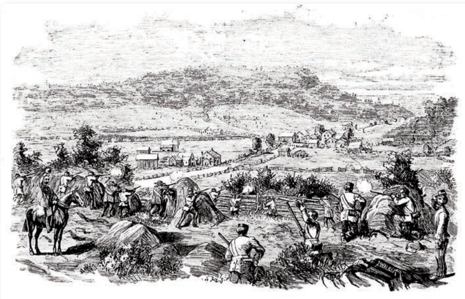
Bataille du 25 juin 1870 à Eccles Hill selon une gravure de John Henry Walker pour le journal anglophone montréalais The Canadian's illustrated de juin 1870.

Cette société secrète ayant déclaré la guerre à l'Angleterre en Amérique du Nord, les colonies britanniques du Canada vivent dans la crainte d'une invasion militaire à partir des États-Unis. Endurcis par la guerre de Sécession, des milliers de vétérans d'origine irlandaise se rallient au mouvement fénienn à la fin de ce conflit en 1865. Des politiciens et militaires américains influents soutiennent les projets irlandais par esprit revanchard.