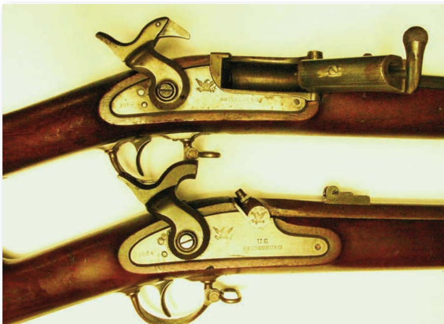
Le fusil d'infanterie Snider-Enfield avec percuteur à cartouche, dont le chargement se fait par une culasse et non par le canon. (Collection Ross Jones)

Tous ces hommes, soldats réguliers, miliciens intégrés à l'armée et miliciens privés, ont combattu côte à côte lors de l'affrontement du 25 mai 1870 qui a mis fin à l'aventure féniennne en territoire canadien.