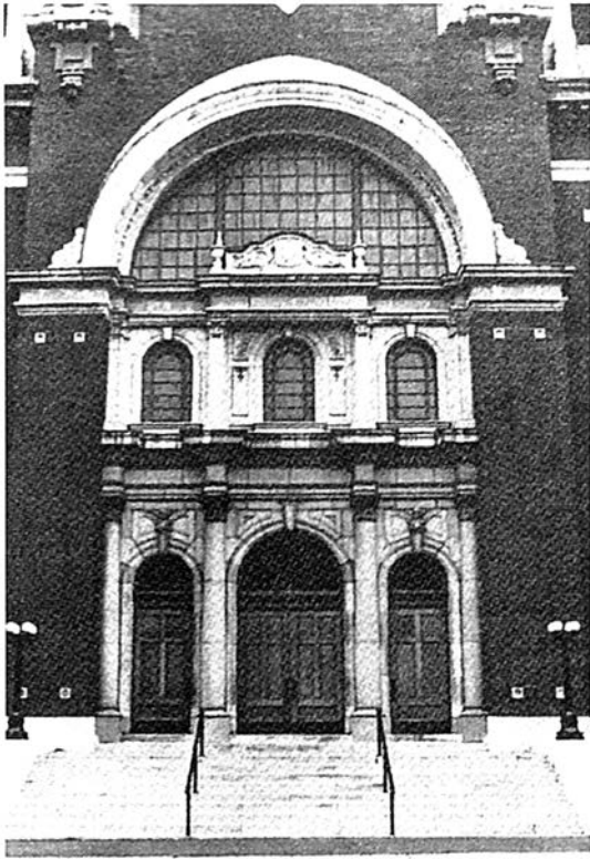
Figure 5 — Église Notre-Dame-des-Victoires de Montréal, vue de l'intérieur, 1976.

thédrales de quartier» que sont les églises de nos grandes villes. L'église Sainte-Marguerite-Marie en est un parfait exemple, elle dont la paroisse fut fermée en 1991 à cause du vacum de sa population et de son appauvrissement. Dans certains cas comme l'église Sainte-Catherine-d'Alexandrie, l'une de ses voisines, elles passent sous le pic des démolisseurs afin de laisser la place pour la construction de logements ou de bureaux quand ce n'est pas pour convertir le site en un lieu de stationnement. Dans d'autres cas, on les convertit en condominium ou en bibliothèque ce qui, à première vue, paraît une solution intelligente de conservation; mais il y a des expériences qui nous ont laissé de jolies coquilles vides ponctuant le paysage urbain et qui n'ont aucun sens. Le cas de l'église Sainte-Marguerite-Marie est beaucoup moins pathétique car elle n'a pas perdu sa fonction culturelle. Mais combien de temps cela va-t-il durer? De nos jours les paroisses n'ont plus assez de ressources financières pour maintenir en vie