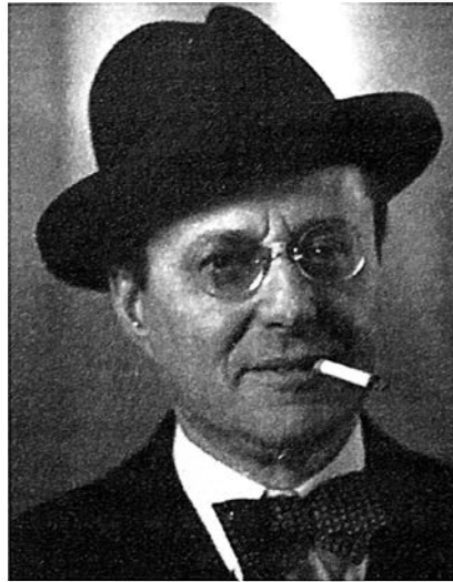
Figure 6 — Ernest CORMIER, architecte-ingénieur (1885-1980).

Né à Montréal en 1885, il décède dans cette même ville au début de l'année 1980. Il débute ses études en génie civil à l'École Polytechnique de Montréal en 1902 et reçoit son diplôme d'ingénieur en 1906. À partir de 1909, il va étudier à Paris à l'École des Beaux-Arts pour parfaire ses connaissances en architecture. Il va obtenir son diplôme de cette institution en 1917. En 1942, l'Université de Montréal va lui décerner un doctorat honoris causa pour l'ensemble de sa carrière. Membre de l'Association des Architectes de la Province de Québec 21 depuis 1918, il deviendra président de cette association en 1929. En 1920, il devient membre de la Corporation des ingénieurs du Québec. Entre 1929 et 1930, il est reçu Fellow de la Royal Institute of British Architects et de l'Institut Royal des Architectes du Canada. Au cours de sa vie, Ernest Cormier sera gratifié de bon nombre de médailles, de