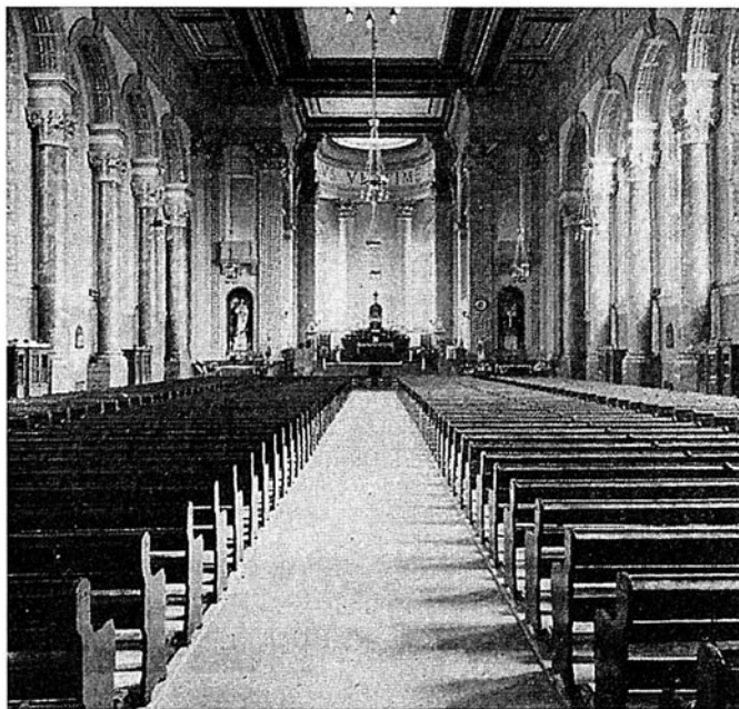
Figure 4 — Église Sainte-Marguerite-Marie de Montréal, vue de l'intérieur, 1948.

De nos jours, la baisse de la pratique religieuse et le dépeuplement des centres urbains causé par le phénomène de la banlieue, nous amènent à nous interroger sur le sort que l'on réserve à ces «ca-