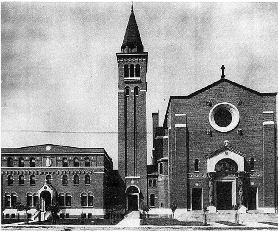
Figure 2 — Église Saint-Ambroise de Montréal, vue de l'ensemble: c. 1933

Les travaux de finition de l'intérieur de l'église se poursuivent au cours de l'année 1925-1926. Initialement, le projet des architectes ne prévoit pas l'implantation d'un décor fastueux. Hormis la colonnade qui ponctue les murs de la nef et du chœur, son entablement paré d'inscriptions 11 et un plafond composé de larges caissons et d'un puit de lumière qui éclaire le cul-de-four du sanctuaire, les architectes se limitent à finir l'intérieur au strict minimum avec des enduits de ciment clair roulé pour les murs et les lambris tandis que la colonnade et le plafond se-