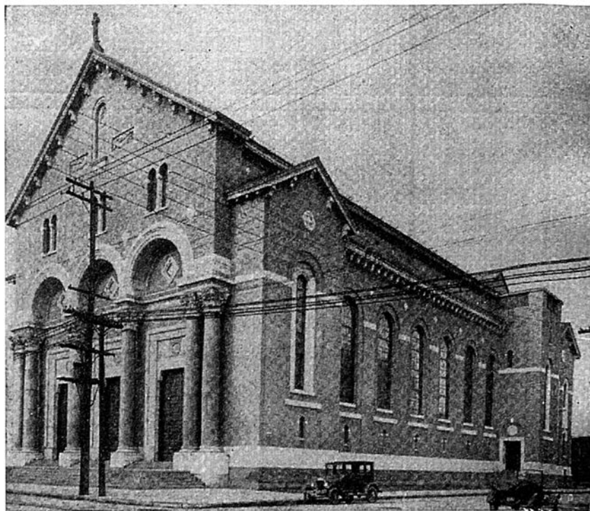
Figure 3 — Église Sainte-Marguerite-Marie de Montréal, vue de la façade et du long pan de droite, c. 1930.

En 1948, à l'occasion du vingt-cinquième anniversaire de fondation de la paroisse, la Fabrique va doter le maître-autel d'un tableau patronymique, oeuvre de l'artiste montréalais Charles Chabauty. 16 Enfin, au début des années 1960, on va renouveler le maître-autel. Un nouveau meuble fait de marbre et de mosaïques et une courtine faite de tissus que l'on tendra sur une armature de fer forgé seront