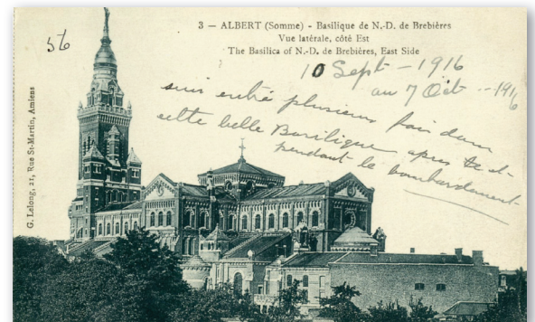
Albert (Somme) – Basilique de N.-D. de Brebières. Vue latérale, côté Est. – [1915]