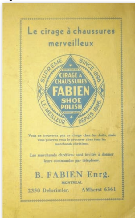
Publicité d'achat chez les chrétiens.