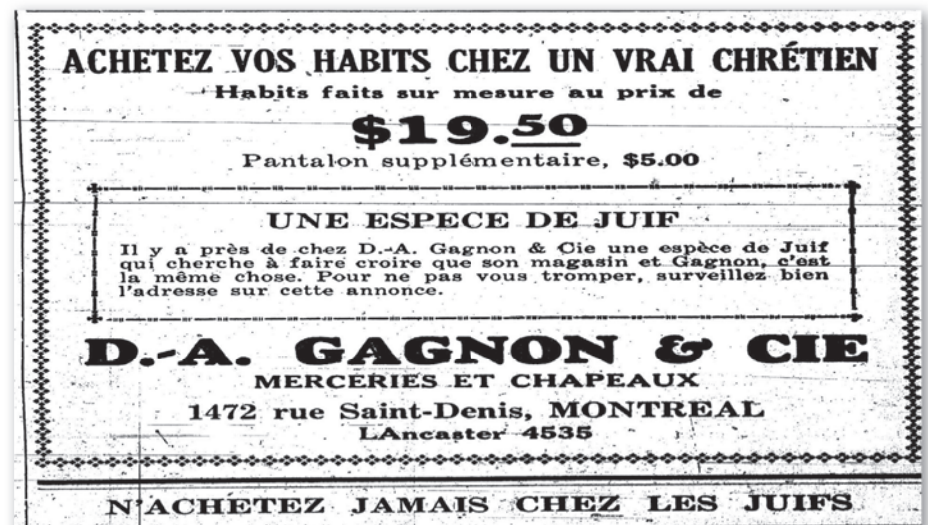
Publicité d'achat chez les chrétiens. (Source : Journal Le Patriote, 16 novembre 1933)