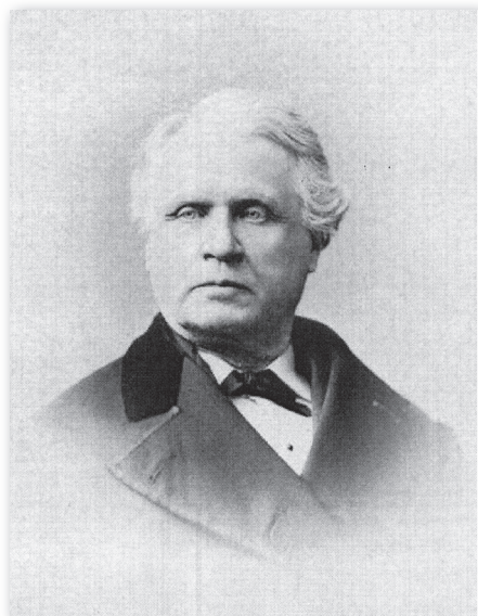
Jean-Charles Chapais (1811-1885). Auteur de l'article intitulé « Le passé, le présent et l'avenir de l'industrie laitière dans la province de Québec », publié dans l'appendice du 25 e rapport de la Société d'industrie laitière de la province de Québec, en guise de témoignage du rôle qu'il a joué dans la modernisation de l'industrie laitière.