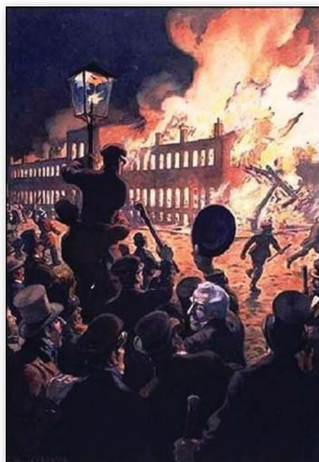
Charles William Jefferys, Burning of the Parliament Buildings in 1849 .

En 1847, la reine Victoria sanctionna une loi permettant au Parlement canadien d'avoir un meilleur contrôle des dépenses publiques. En mars 1848, le principe de responsabilité ministérielle, qui permettait la mise en place d'un parlementarisme véritable, fut promu. Dans les semaines qui suivirent, les restrictions d'usages