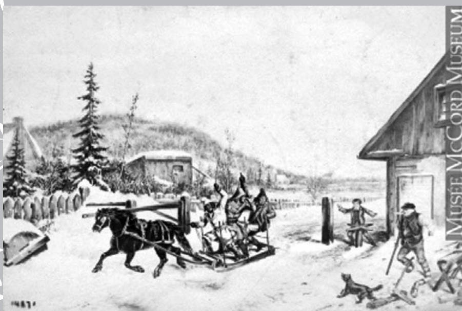
La barrière de péage, peinture de C. Krieghoff, copie réalisée en 1865. William Notman (1826-1891), 1865, XIX e siècle.