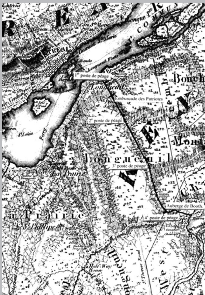
Sites approximatifs des quatre postes de péage, de l'embuscade des Patriotes et de l'auberge de Booth, sur le chemin de Chambly. (Source : carte de Joseph Bouchette en 1815)

Ainsi ce chemin, d'abord militaire, abandonné à l'entretien seigneurial, confié ensuite à l'entreprise privée, remis aux municipalités puis transféré au gouvernement, avait rivalisé avec le transport fluvial et avec les chemins de fer. Que dire de l'entretien d'hiver et des rivières à franchir, comme le Richelieu, sur des ponts devenus fragiles et étroits pour les véhicules automobiles... Mais ça, c'est une autre histoire.