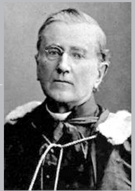
Cyprien Tanguay.

Au tournant du xx e siècle, nous retrouvons même des historiens faisant oeuvre de généalogistes dans leurs publications historiques : Joseph-Edmond Roy ( Histoire de la Seigneurie de Lauzon , cinq volumes publiés à Lévis entre 1897 et 1904) et l'abbé Henri-Arthur Scott ( L'Histoire de Notre-Dame de Sainte-Foy , vol. 1 (le seul paru), publié à Québec en 1902). Notons aussi qu'avec l'arrivée en 1895 du Bulletin des recherches historiques , naissait au Québec la première revue offrant des articles à caractère nettement généalogique. On trouve dans cette application, qui s'est éteinte en 1968, comme aussi dans d'autres, de nombreux écrits touchant cette science par des auteurs de choix comme Pierre-Georges Roy, Édouard-Zotique Massicote, Archange Godbout, etc. Nous constatons que, sous l'impact de Tanguay, une production typiquement généalogique commence à voir le jour sous différentes formes. Certains, comme Roy, Massicote et Fauteux, laïcs pour la plupart, s'intéressent davantage à la généalogie des grandes familles, tandis que d'autres, en grande partie membres du clergé ou des ordres religieux, se sont plutôt appliqués à relever les actes d'état civil, surtout les mariages, de toutes les gens de leur loca-