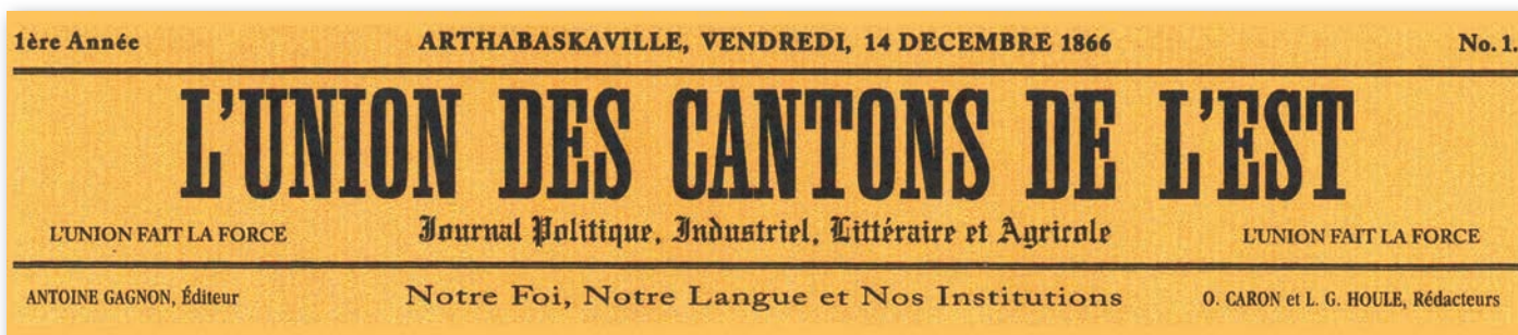
L'entête de la première parution de L'Union des Cantons de l'Est , le 14 décembre 1866.

De janvier à mars 1867, ce sera une lutte à finir entre L'Union des Cantons de l'Est et Le Défricheur . Les accusations et les attaques se multiplient. Le 14 février, L'Union des Cantons de l'Est publie trois textes pour s'en prendre à son concurrent qu'il accuse d'être « hors d'ha-leine et poussé au pied du mur », de ne pas respecter l'Évangile et d'être contre l'Église catholique. La semaine suivante, le journal écrit : « Pauvre Défricheur , qu'il est à plaindre », en faisant allusion à des critiques contre le gouvernement. Le Défricheur de Laurier ne mâche pas ses mots lui non plus et soulève la colère du curé Suzor et de M sr Laflèche.