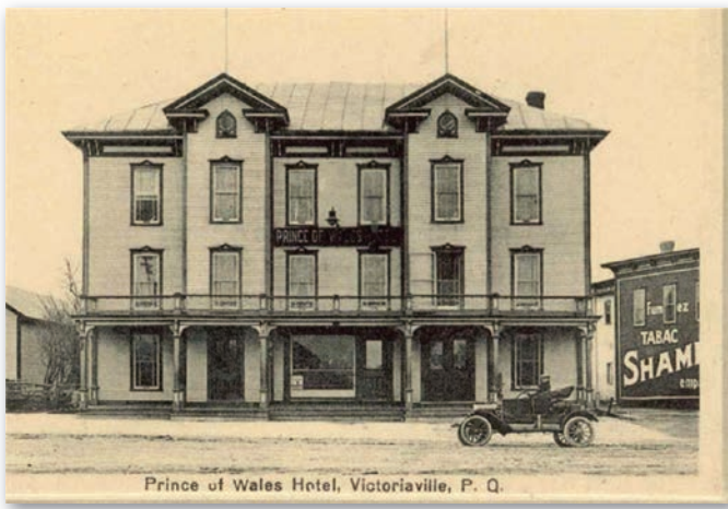
Prince of Wales Hotel, Victoriaville, P. Q.