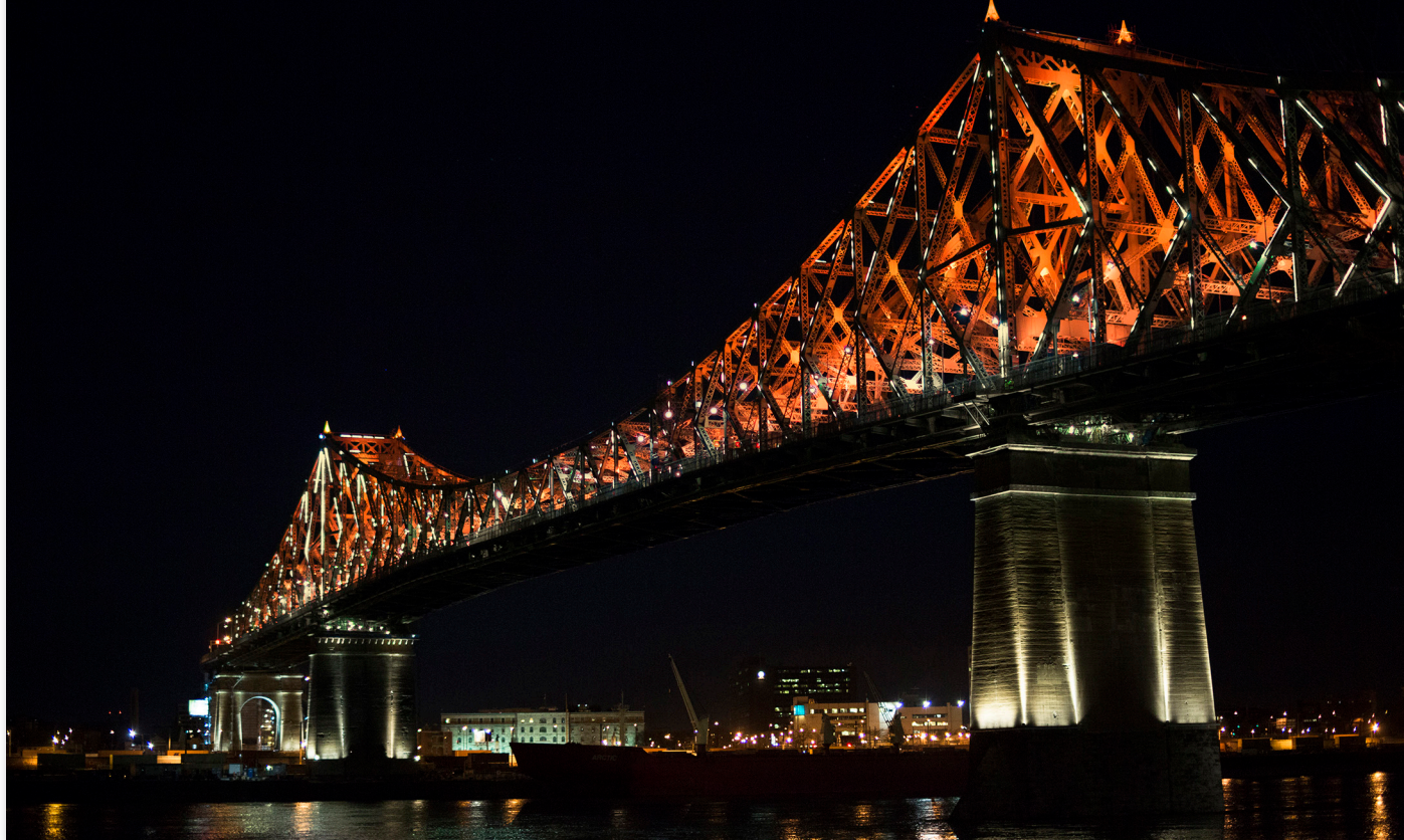
Le pont Jacques-Cartier illuminé pour le 375 e anniversaire de Montréal, 2017.