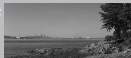
La pointe ouest de l'île d'Orléans.

Paradoxe intéressant, Horatio Walker passe la plupart de ses hivers à New York, d'abord pour échapper à la rude saison, puis pour y vendre ses toiles. De la résidence cossue qu'il possède à la pointe ouest de l'île d'Orléans, Walker jouit d'une vue imprenable sur la ville de Québec. Mais lui et les peintres qu'il attire à l'île préfèrent exploiter une tout autre perspective. Plusieurs d'entre eux logent chez la famille Sanschagrain qui habite l'extrémité est de l'île, là où la nature domine le paysage, face au large estuaire du Saint-Laurent et à l'imposant cap Tourmente. Cette tension entre nature et culture, entre New York et l'île d'Orléans,