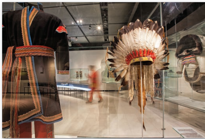
Vue de l'exposition permanente Porter son identité , MG 25544

Cette première réflexion me donne les outils pour étudier dans un deuxième temps l'inclusion des expertises autochtones et l'intégration de l'art contemporain des Premières Nations dans les expositions. Depuis sa réouverture en 1992, le Musée McCord a présenté en moyenne une exposition à thématique autochtone par an. Les artefacts de la collection Cultures autochtones, qui compte plus de 16 000 artefacts dont le noyau historique de 1 500 artefacts ethnographiques et de 1 000 spécimens archéologiques a été amassé par le fondateur David Ross McCord, sont très régulièrement présentés. À cela s'ajoutent plusieurs expositions créées par d'autres musées, allochtones et autochtones, que le McCord reçoit. Au total, mes recherches ont révélé que les expertises autochtones avaient été intégrées dans 22 des 29 expositions étudiées.