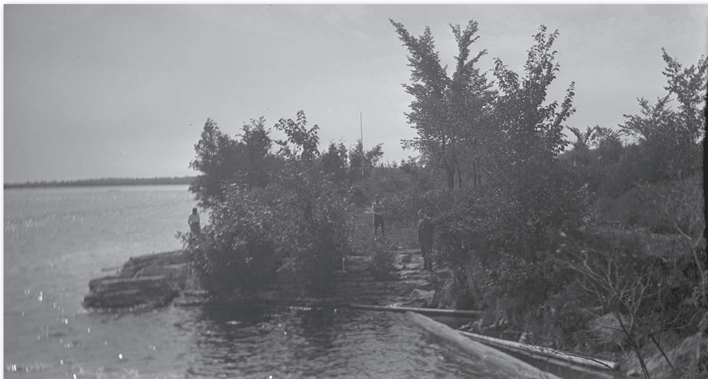
« Foot of Second Portage Le Portage du Milieu of Champlain », 23 août 1932. MKAN 4542785 [Photographe Francis Latchford], Bibliothèque et Archives Canada.

D'autre part, cette interprétation pourrait plus largement interpeller les Gatinois dans leur ensemble de même que les visiteurs . L'histoire derrière le lieu pourrait être présentée de diverses façons pour attirer l'attention du touriste, de l'écolier, du promeneur, du kayakiste, du cycliste.