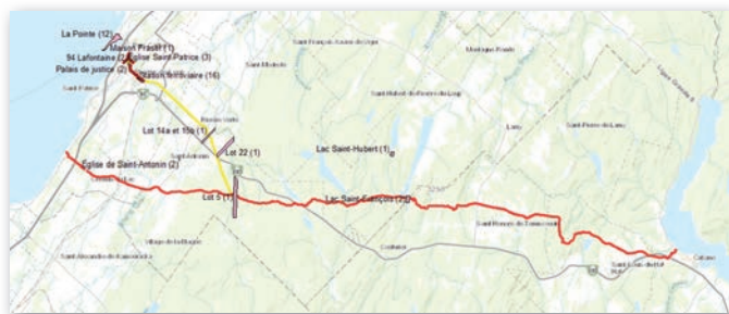
Le nombre de causes par lieux du délit sur le tracé du chemin du Portage entre 1860-1900 (ArcGIS).