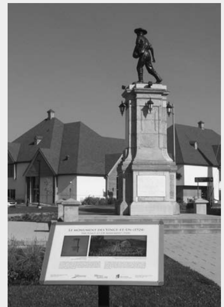
Le monument des Vingt-et-Un à La Baie après sa restauration de 2011.

Même encore aujourd'hui, les travaux des membres de la Société des Vingt-et-Un demeurent un point fort de l'histoire du Saguenay—Lac-Saint-Jean. Traditionnellement, le 11 juin marque la naissance de la région, et cette date prendra cette année une couleur particulière. En ce 175 e anniversaire du Saguenay—Lac-Saint-Jean, c'est une région tout entière qui va se souvenir de ses pionniers, de leur labeur et du sentiment d'abnégation qui motivait leurs travaux.