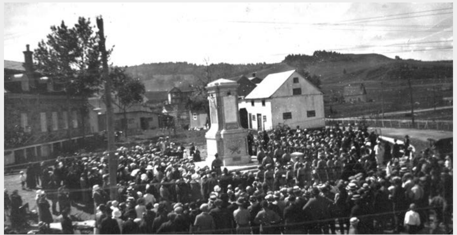
Inauguration du monument des Vingt-et-Un le 29 juin 1924.

Depuis le 11 juin 1938, année des célébrations du centenaire de la région, on souligne annuellement l'arrivée des Vingt-et-Un à Grande-Baie. Cet événement patriotique est agrémenté, depuis 1969, de la nomination d'un membre de l'Ordre des Vingt-et-Un. Un comité chapeauté par la Société historique du Saguenay nomme, le 11 juin