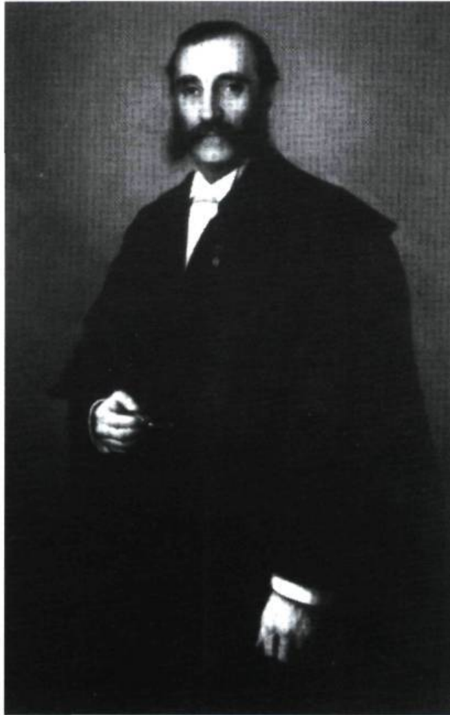
Félix-Gabriel Marchand (1832-1900)

La tenue de ce colloque me permet de souligner que l'année 1997 coïncide avec le centenaire de l'accession de Félix-Gabriel Marchand au poste de premier ministre du Québec le 24 mai 1897.