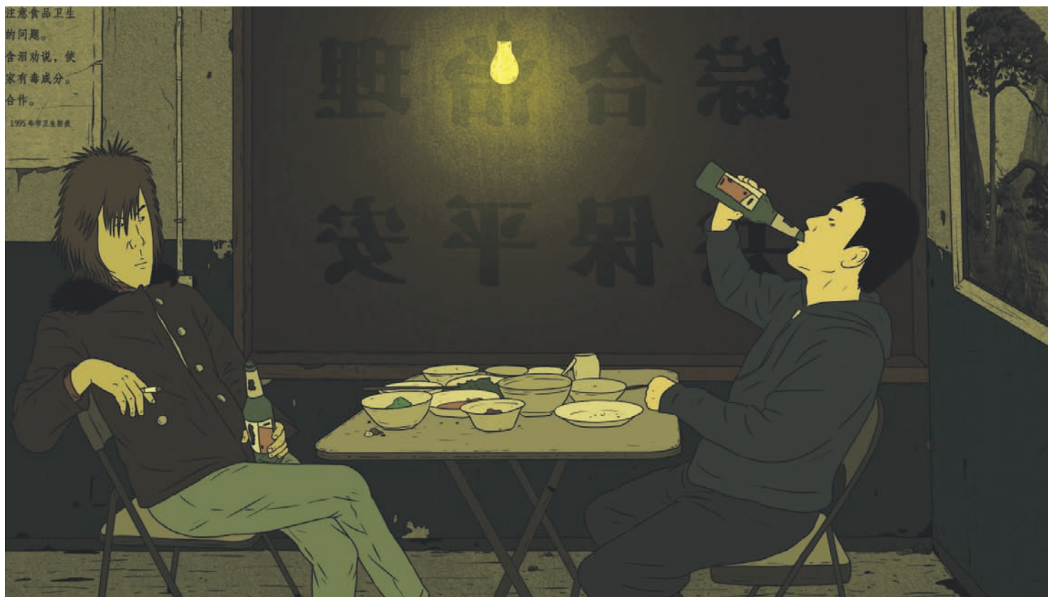
Piercing 1 (2009) de Liu Jian

En 2008, la Cinémathèque québécoise consacrait une séance au cinéma d'animation chinois contemporain. Fait révélateur, 10 des 14 courts métrages alors programmés étaient des films étudiants, un onzième, Pan Tian Shou (2003) de Joe Chang, ayant été réalisé par un Sino-Canadien installé à Hangzhou pour prendre la direction du département d'animation de la China Art Academy. Du groupe