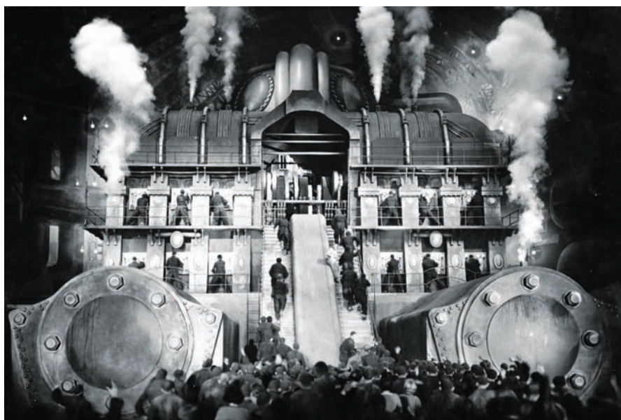
Metropolis (1927) de Fritz Lang, récemment restauré et diffusé en version numérique.