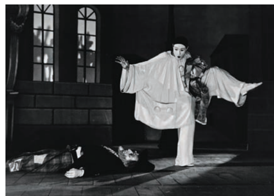
Les enfants du paradis (1945) vient d'être numérisé par les laboratoires Éclair.