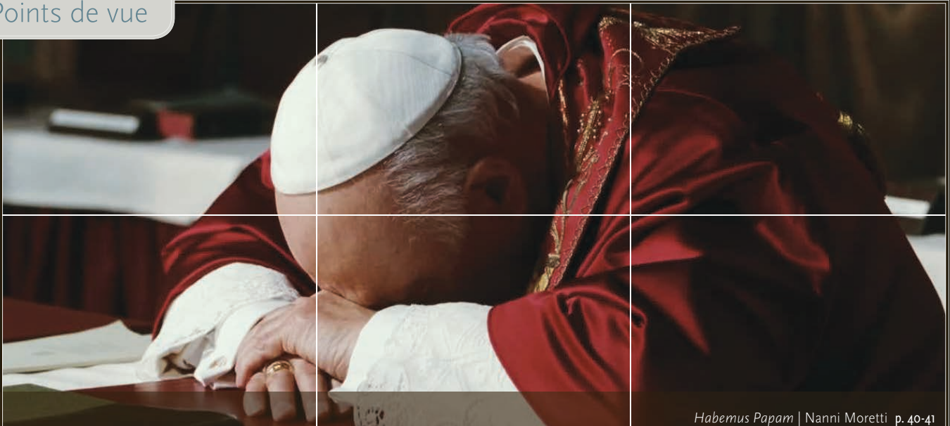
Habemus Papam | Nanni Moretti p. 40-41