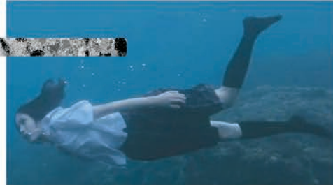
STILL THE WATER NAOMI KAWASE