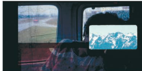
LE JOUR NOUS ÉCOUTE FÉLIX DUFOUR-LAPERRIÈRE