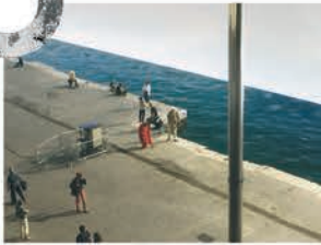
JOURNEY TO THE WEST TSAÏ MING-LIANG