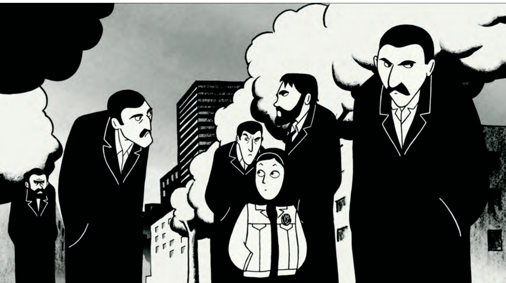
PERSEPOLIS (2007) de Marjane Satrapi

appartenant au même univers en viennent à se répondre les unes les autres, s'entrecroisant par le biais de films-événements où se recourent les différentes pistes narratives exposées dans les œuvres. Cette sérialité hybride emprunte sa logique de fonctionnement à la bande dessinée, mais elle tente aussi de répondre à la popularité grandissante des séries télé : ce qu'il s'agit désormais de transposer, c'est une tactique de mise en marché.