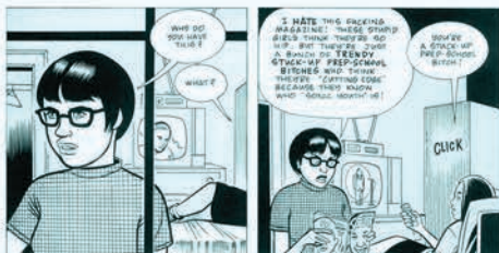
GHOST WORLD DAN CLOWES