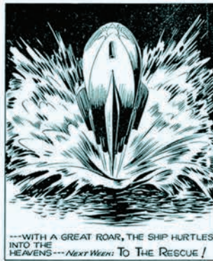
FLASH GORDON ALEX RAYMOND