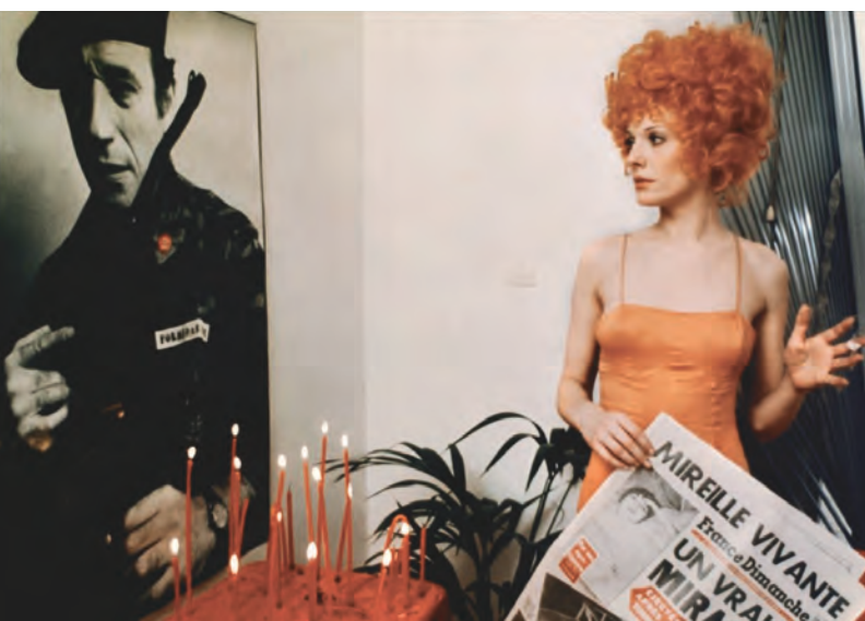
MISTER FREEDOM (1969) de William Klein