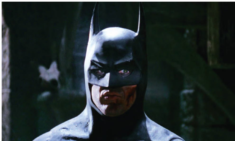
BATMAN (1989) de Tim Burton

ARTS PROPRES AU XX E SIÈCLE ET, PAR CONSÉQUENT, À UNE CERTAINE VISION CAPITALISTE DE L'ART, LE CINÉMA et la bande dessinée ont eu à composer presque dès leur naissance avec leur double nature d'activité créative et de commerce. Comme si leur forme même, intimement liée à la reproduction mécanique, appelait à leur industrialisation. Ainsi, tandis qu'Hollywood imposait sa mainmise sur le septième art, le neuvième devenait l'apanage d'une poignée de « grands éditeurs » qui, aujourd'hui encore, dictent à plusieurs égards les règles du jeu.