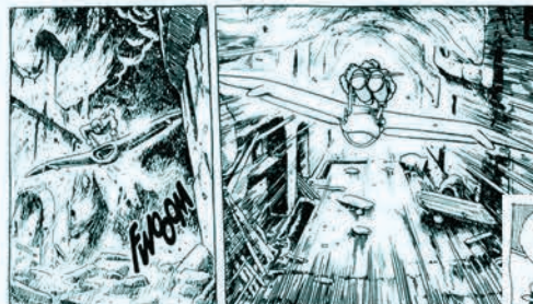
NAUSICAA DE LA VALLÉE DU VENT HAYAO MIYAZAKI