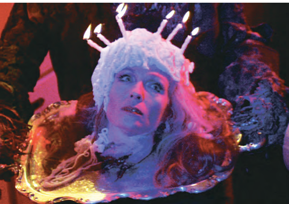
CREEPSHOW (1982), de Georges A. Romero

dans Mallrats (1995) où il joue son propre rôle avec une fierté rayonnante. Puis, en 1997, le cinéaste se glisse dans les coulisses de la bande dessinée avec son troisième long métrage Chasing Amy . Maintenant que ses créateurs apparaissent à l'écran, celle-ci ne relève plus simplement du vague bassin d'idées dans lequel on pige au hasard. Et gageons que, par le biais d'une blague à son sujet, plusieurs spectateurs apprendront ce qu'est le métier d'encreur.