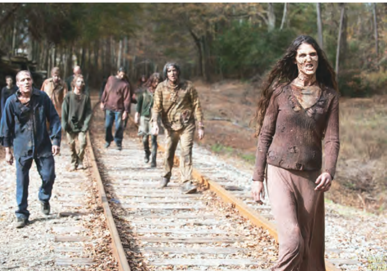
THE WALKING DEAD (saison 3)