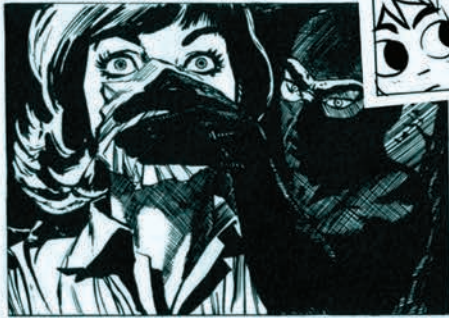
DIABOLIK ANGELA ET LUCIANA GIUSSANI