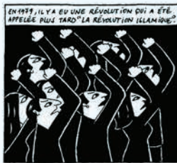
PERSEPOLIS MARJANE SATRAPI