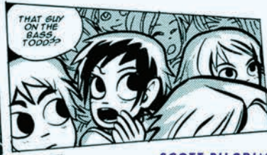
SCOTT PILGRIM BRYAN LEE O'MALLEY