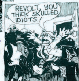
FRITZ THE CAT ROBERT CRUMB