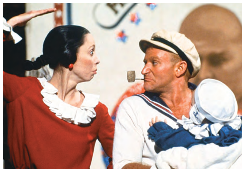
POPEYE (1980) de Robert Altman

à un univers parallèle où la réalité est irrémédiablement distordue : la bande dessinée.