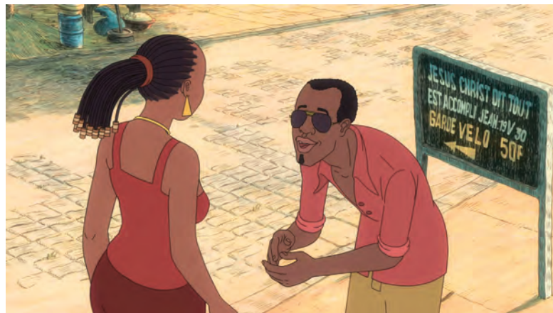
AYA DE YOPOUGON (2013) de Marquerrite Abouet et Clément Oubrerie

De plus en plus, on entend même certains dessinateurs parler en termes d'angles « de caméra » – la case n'étant plus qu'un simulacre du cadre. La bande dessinée met alors en péril sa spécificité formelle. Dans cette optique, elle n'est plus qu'un simple découpage technique ou encore un sous-produit, similaire au cinéma, qui se contente un peu bêtement d'en reproduire les mécanismes. Et dès lors, le dialogue entre les arts n'en est plus un. 📺