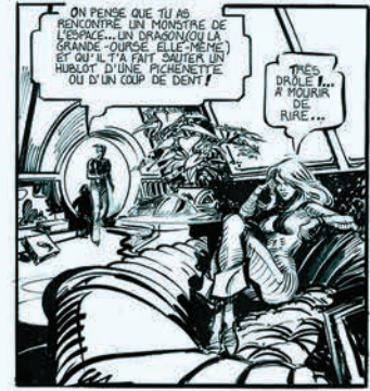
BARBARELLA JEAN-CLAUDE FOREST