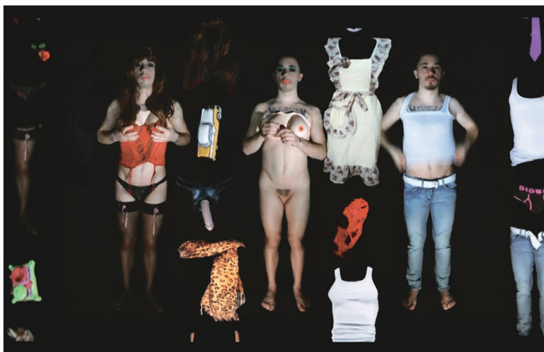
NOUS SOMMES TOUTES DES TRAVESTIES de Gérard Chauvin

L'humanité accorde des violons, des désirs, des corps, des images et des sons... C'est l'une des singularités qui la distingue des animaux et des plantes. En accordant, elle commet aussi des discordes, des raccords dans le mouvement au-delà des limites de son territoire. Elle transforme ce qu'elle touche et se transforme de ce qui la touche. Vivre ou créer, c'est entrer en transe, en un état second qui transgresse les disciplines artistiques ou les frontières en tout genre. Le corps humain est un inter-mutant du spectre de l'art et des cartographies politiques, qui outrepassa passionnément le mauvais genre quand il rejoint le genre humain mutant.