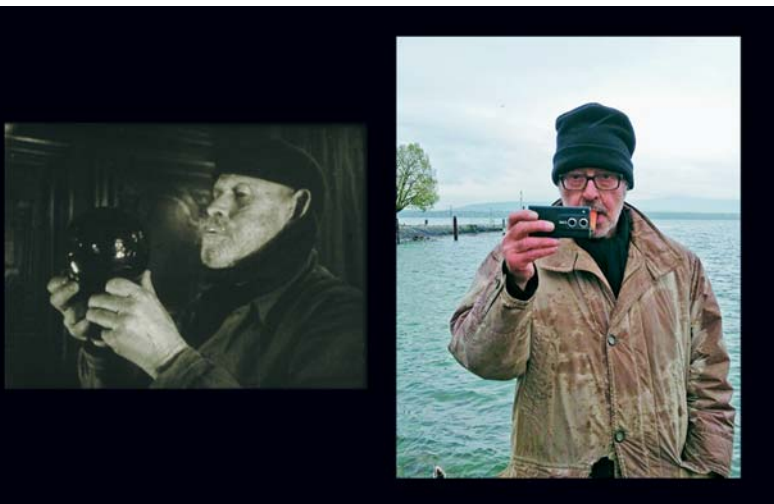
LE TEMPESTAIRES (1947) Jean Epstein. Jean-Luc Godard

3 La puissance pure de la toute dernière mutation du cinéma, le dernier cri de la modernité, apparue dans les années 1980-1990, a tout cassé. Aucun scoop. Juste un constat honnête et visible par tous. Que nous soyons cinéastes, producteurs, distributeurs, exploitants, télévisions, critiques, spectateurs. Sans faire d'histoires. Cette mutation est même apparue aux yeux de beaucoup comme hautement désirable, comme un grand pas démocratique vers ce qu'elle appelle une véritable démocratie : un monde enfin débarrassé de l'Histoire, entièrement dominé par le marché. Étrange connexion. Le cinéma pourrait continuer à vivre dans un monde où l'histoire aurait cessé d'exister ? Que dire alors des peuples, qui depuis Chaplin, Eisenstein, Ford, Pasolini, ont toujours été les plus grands héros du cinéma. Les regardons-nous encore