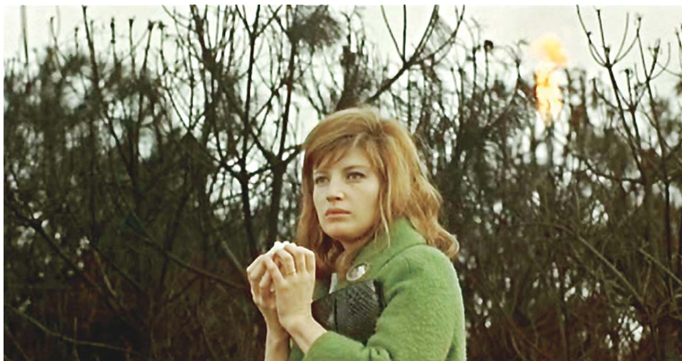
LE DÉSERT ROUGE (1964) Michelangelo Antonioni

1 Impossible de parler de cinéma sans parler de Révolution. Celles qui ne sont plus, celles qui ont lieu sous nos yeux, celles qui arrivent. C'est le cœur même du cinéma. La manière dont le cinéma accompagne le monde d'une époque à une autre, d'un monde à l'autre. La nature révolutionnaire du cinéma est incontournable. Révolutionnaire, comme l'art et l'industrie. Le cinéma ne tient pas en place, jamais. Il ne tient pas en place, parce qu'il puise son existence dans la technique. Et principalement dans les révolutions de la technique. Celles qui ont donné le cinéma muet jusqu'au téléchargement, la diffusion sur Internet, et déjà, au-delà.