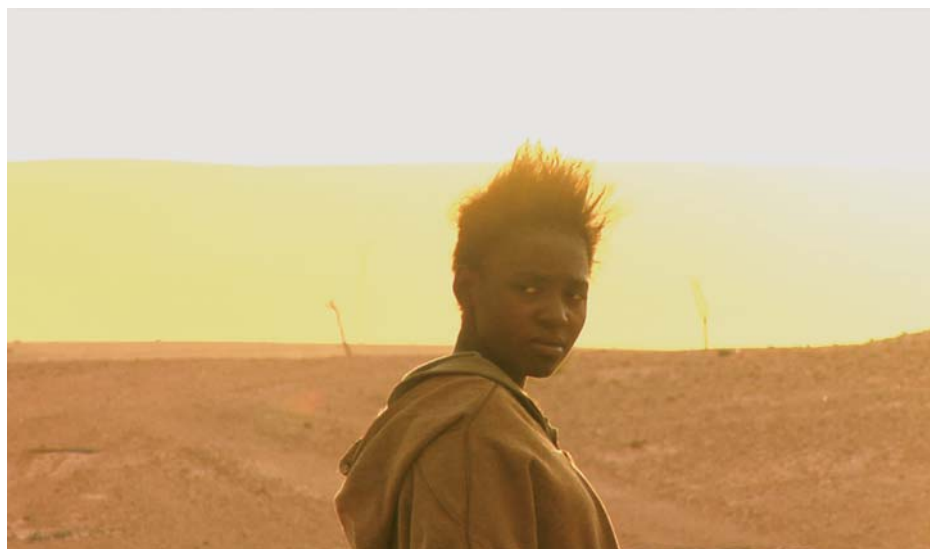
INLAND (2008) Tariq Teguia

Le spectateur-cinéophile par exemple. Reste-t-il seulement pour nous un vague souvenir ? Une trace sérielle habitant les revues de cinéma, les « vieux films » ? Nos mémoires, nos discussions amoureuses, les livres de cinéma du siècle dernier, les musées ? S'est-il transformé comme on nous l'a martelé en espaces de cerveaux disponibles , en statistiques, pourcentages, catégories, chiffres ? Sommes-nous encore un tant soit peu ses descendants ? Sommes-nous encore un peu ? beaucoup ? pas du tout ? connectés à lui. Nous, dont les regards sont organisés, dirigés, occupés, par toutes sortes de stratégies de captations médiatiques et industrielles ? Pendant que celui du spectateur-cinéophile découvrait, décennie après décennie, dans des dizaines de milliers de films, l'immensité éblouissante de sa liberté de voir et de penser le monde – seul et avec d'autres – comme pour la première fois .