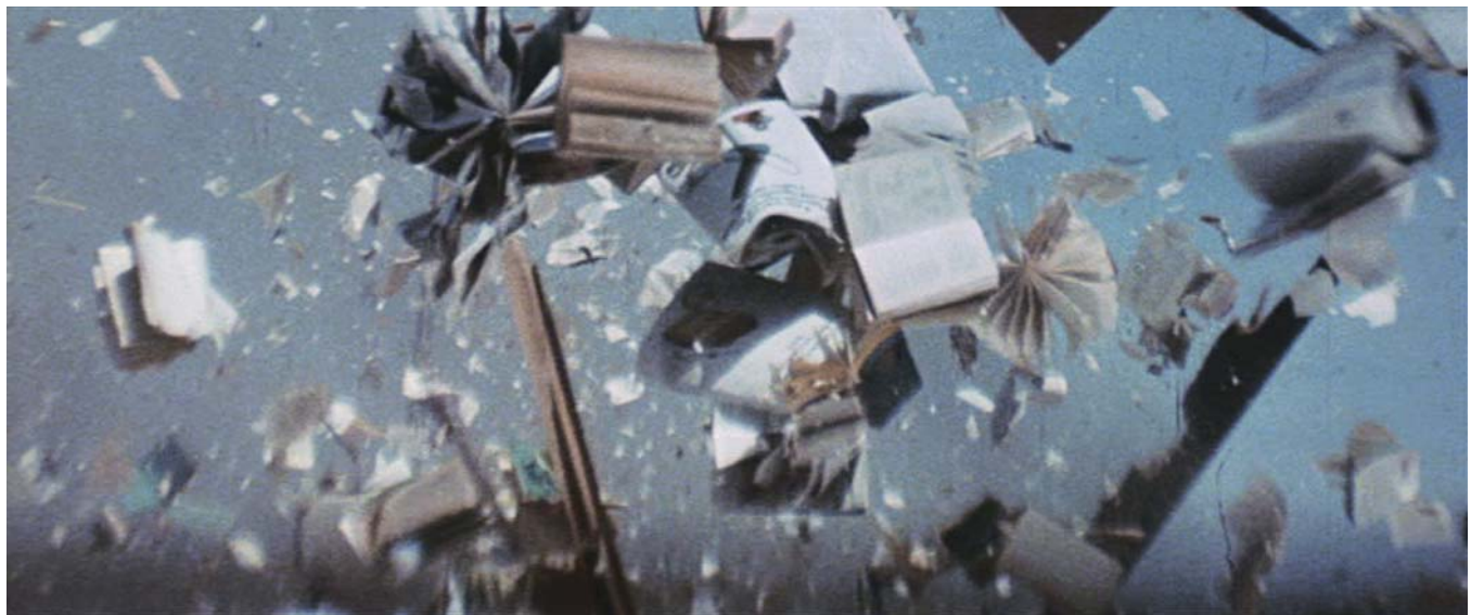
ZABRISKIE POINT (1970) Michelangelo Antonioni

« Mouvement spontané dont la nature même contournerait les salles de cinéma et dont la puissance pourrait briser l'esclavage de l'actualité cinématographique en la redéfinissant entièrement. »