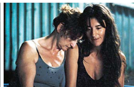
VIC+FLO ONT VU UN OURS (2013)

Certes, Félix et Meira constitue en quelque sorte une exception, car la quête identitaire des protagonistes s'inscrit dans un contexte intercommunautaire, sur lequel l'intrigue prend appui, mais on n'en demeure pas moins au niveau du questionnement personnel et les enjeux sociaux qui dépassent le cadre du triangle amoureux sont rapidement évacués. Et si la problématique sociale se voit exclue de ce cinéma d'auteur, que dire du contexte politique – ou, pire, de la prise de parole politique – carrément anathème ! À mon sens, une scène de Sarah préfère la course , qui se veut humoristique, est d'ailleurs emblématique de cet état de fait : la réalisatrice se gausse d'un journaliste anglophone maladroit qui demande à Sarah si elle est fière d'être une athlète canadienne, mais elle répond en somme qu'elle n'est ni fédéraliste, ni nationaliste, qu'elle est seulement fière de ses temps et de gagner ses courses. Est-ce de l'ironie ? Chloé Robichaud dénonce-t-elle le désengagement politique de son personnage ou, au contraire, l'endosse-t-elle ? Si elle le dénonce, pourquoi ne s'en tenir qu'à cette parenthèse ?