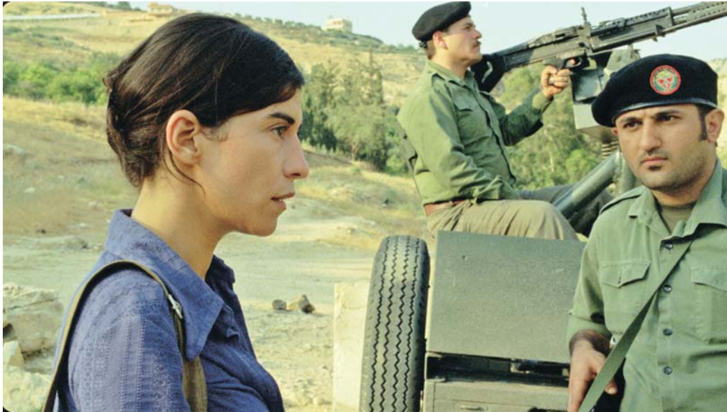
INCENDIES (2010) Denis Villeneuve