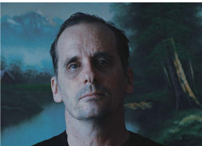
FULL LOVE (2013)